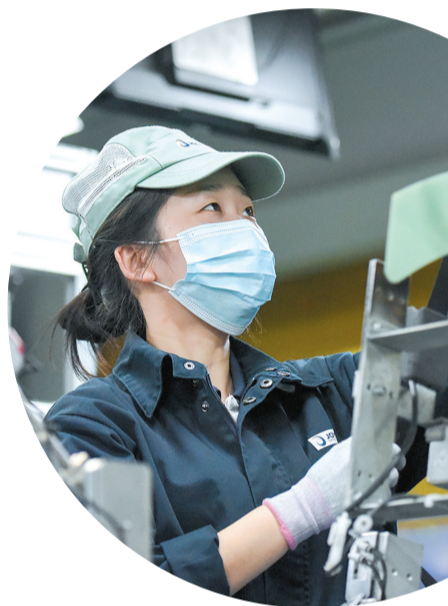
▲日前,均胜汽车安全系统(荆州)有限公司车间里一片忙碌,各生产线开足马力,力争实现新年“开门红”。该公司是一家全球汽车安全系统零件配套商,主要生产汽车安全气囊、安全带和方向盘,服务本田、丰田等国际知名车企和国内大部分汽车整车企业。