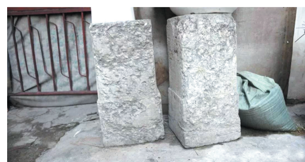
萧家坊观音寺的石质构件

如今,通过旧城改造,旧时代的萧家坊早已荡然无存。但在梅台巷菜市场的那边住宅楼中,以中间过道为界,西侧民居楼栋仍以“萧家坊”为名排序。但愿后来在看到这个名字的时候,能记得本地曾出过一位著名贤臣萧大宾,或者叫陈大宾,同时知道他在明朝时期云南的社会进步与发展上,曾经有过突出政绩。