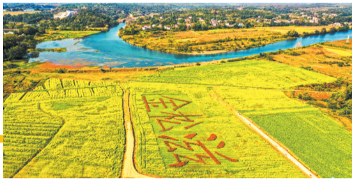
荆州农业科学院助力纪南文旅区、松滋流水、石首市等地打造多彩油菜花海。