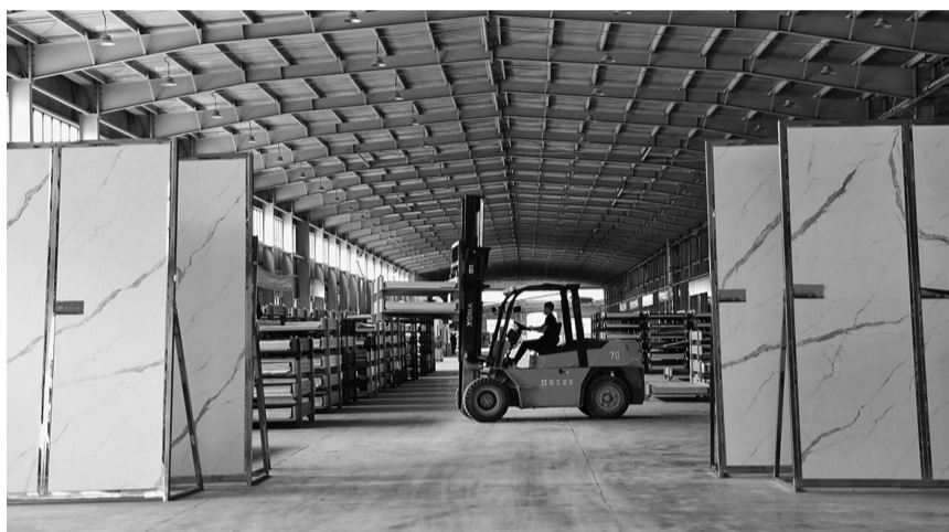
美好超薄岩板车间一角。

日前，记者来到洪湖市一泰科技有限公司厂区，只见车间内一片火热。工人们在生产线上娴熟地操作各种机械设备，大家各司其职，全力抓生产进度，保证产品供应。