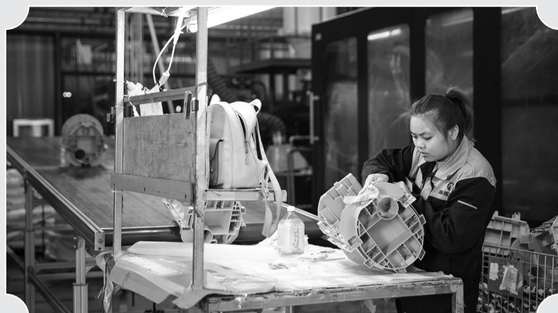
南雁新材料科技有限公司生产车间