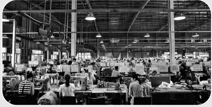
威弘鞋业生产车间。