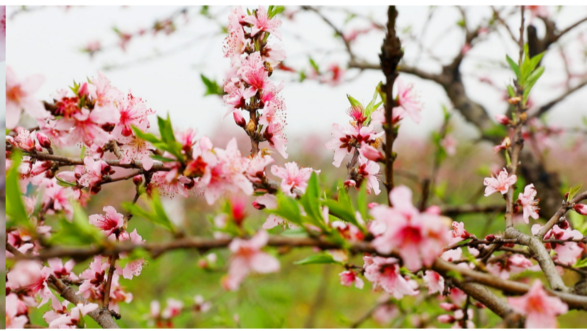
“桃之夭夭,灼灼其华”