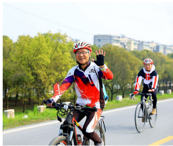
“守护美丽洪湖,我们又不容辞”