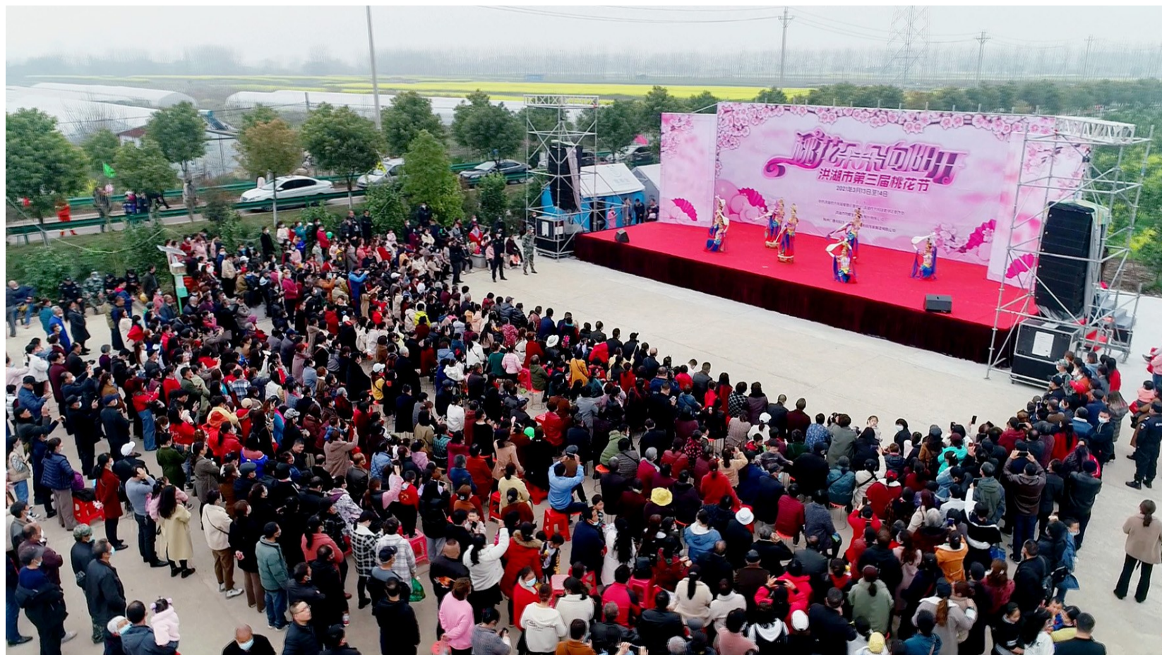
文艺表演拉开桃花节序幕