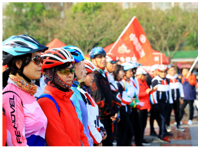
为生态保护出一份力