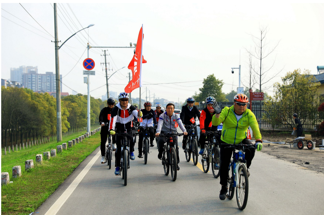
骑行队员沿江堤出发