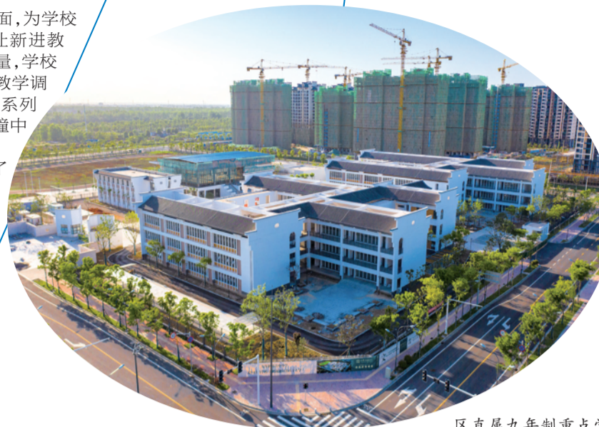
区直属九年制重点学校——纪南文旅区实验学校全校貌

该校的建成使用,充分发挥了优质教育资源的辐射、引领作用,合理布局了城区义务教育资源,为教育均衡发展做出应有贡献,备受广大家长青睐。同时,与保利·公园壹号国际幼儿园、省级重点荆州中学共同构建全方位、一站式的优质教育集群,展现出了区域的发展气魄,更新完善了区域的教育配套与人居环境。