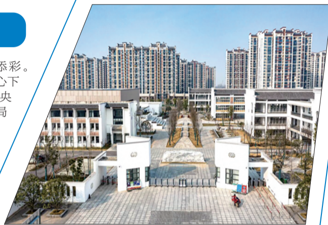
区直属九年制重点学校——纪南文旅区实验学校环境宜人

“人谓荆州好,文忠百代高。居正留足迹,小学传大道。”未来的张居正小学,将依托“张居正”传统资源,继续深化“居正有为”的教育品牌,打造出办学特色鲜明、办学成绩突出的,沙市区高品质现代城市教育的典型代表。