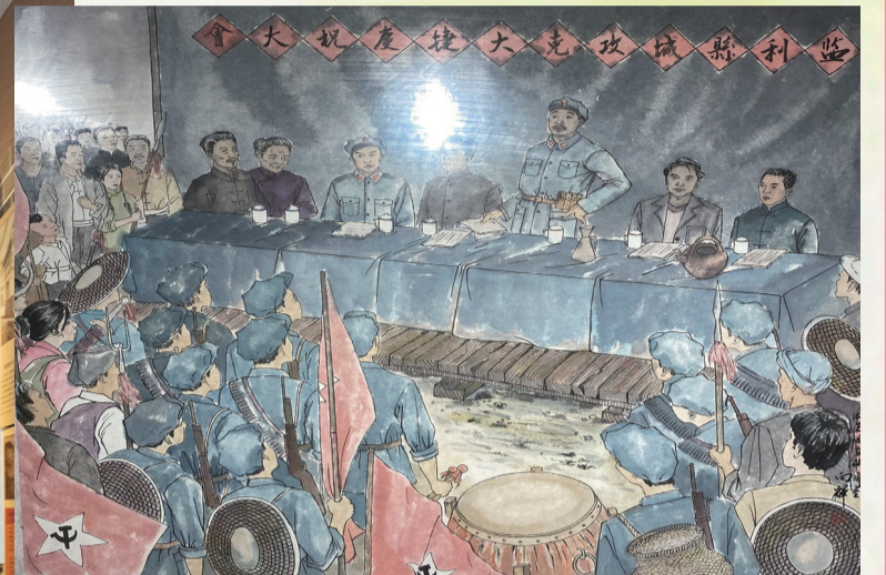
▲打下监利城后，贺龙慰问陈步云等烈士家属。(画作，翻拍于监利市革命历史博物馆)