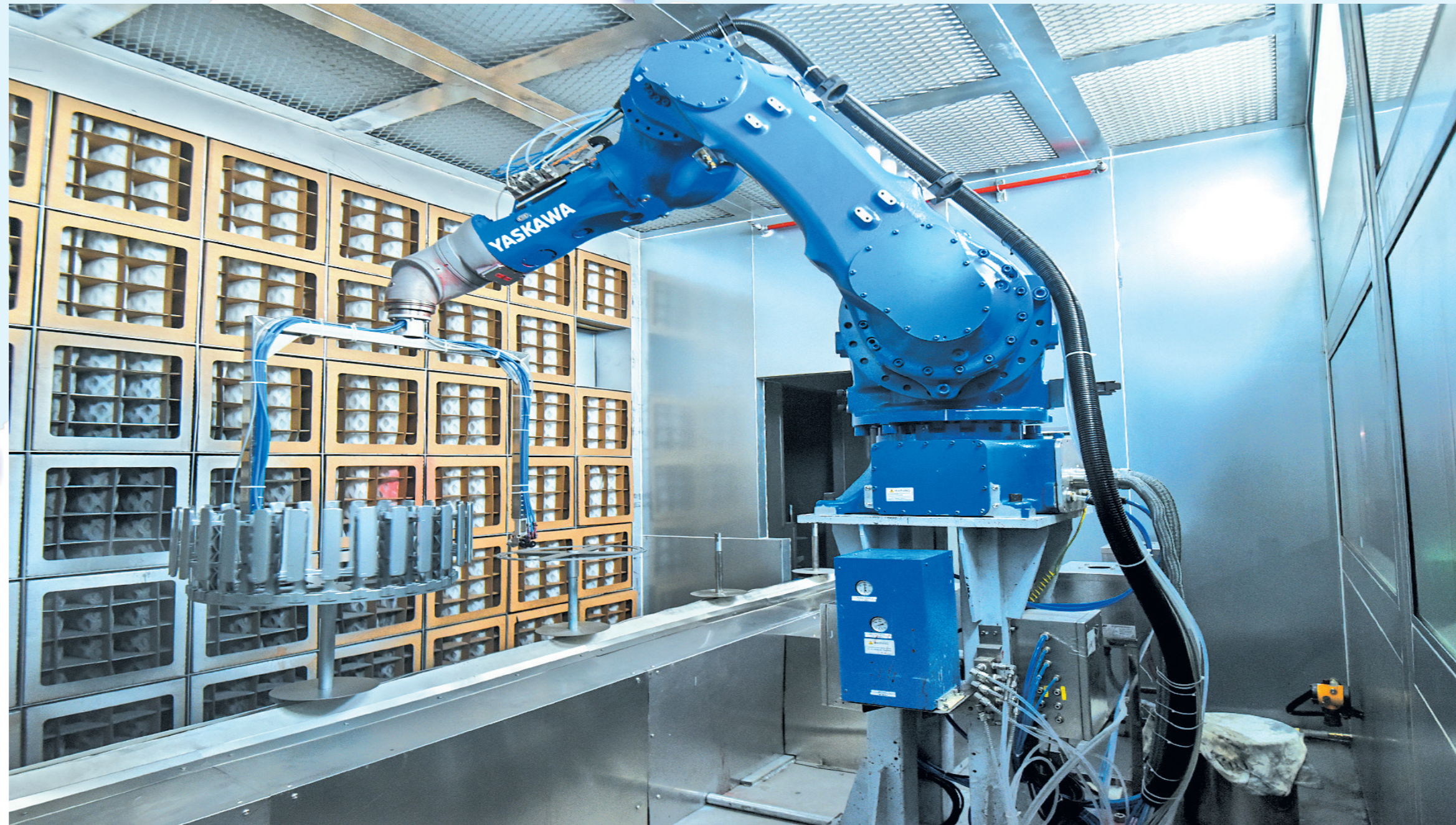
伟信达(中国)汽车安全系统有限公司智能生产线。

项目总投资3214251万元,累计完成投资11000万元。规划主园区占地300.2亩,其中殡仪区占地面积约203.5亩,人文纪念公园占地面积约96.7亩,配套设施生态停车场占地55亩。殡仪区主要新建悼念厅、告别厅、综合办公楼、职工食堂及休息室、客体餐厅及客服楼等,建筑面积约33000.0平方米;人文纪念公园绿化处理,建设完成电气系统、给排水系统、路面硬化、景观绿化、环保等配套设施。项目着力打造为全社会服务的窗口,是社会主义核心价值观建设的一个阵地,将起到移风易俗和引导合理消费的作用。