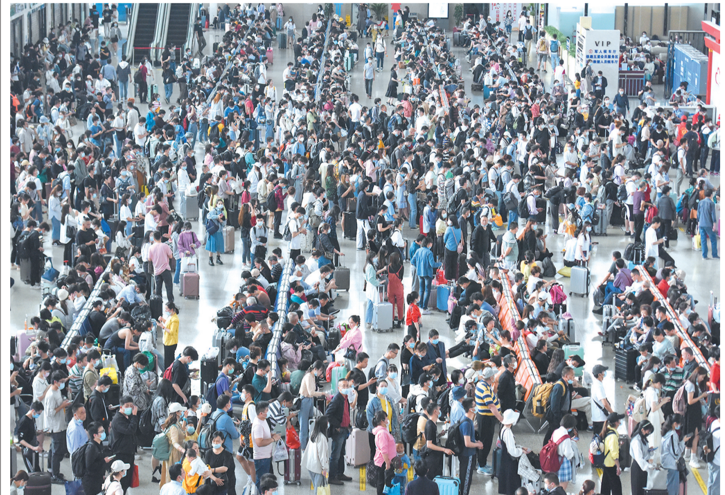
“五一”假日期间,江汉铁路客流大幅增加,荆州火车站迎来客流高峰。

区商圈、重要景点路段进行督导检查。此外,各交警大队加强重点景区、节点路段值守,加强对客运站车辆安全检查,并对行驶车辆轨迹、疲劳驾驶进行监管,严查客车、面包车超员超速违法行为,还启动劝导站,开展交通安全劝导。 随着高速公路车流量明显增加,高警江南、江陵大队还组织警力,强化路面巡逻管控,严查应急车道违法停车等行为,并开展安全提醒,为人民群众出行创造安全畅通的交通环境。