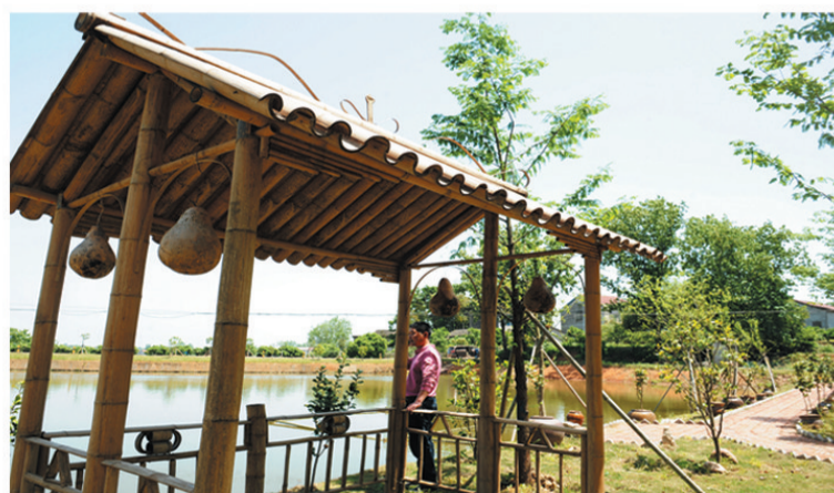
村民休闲纳凉好去处。