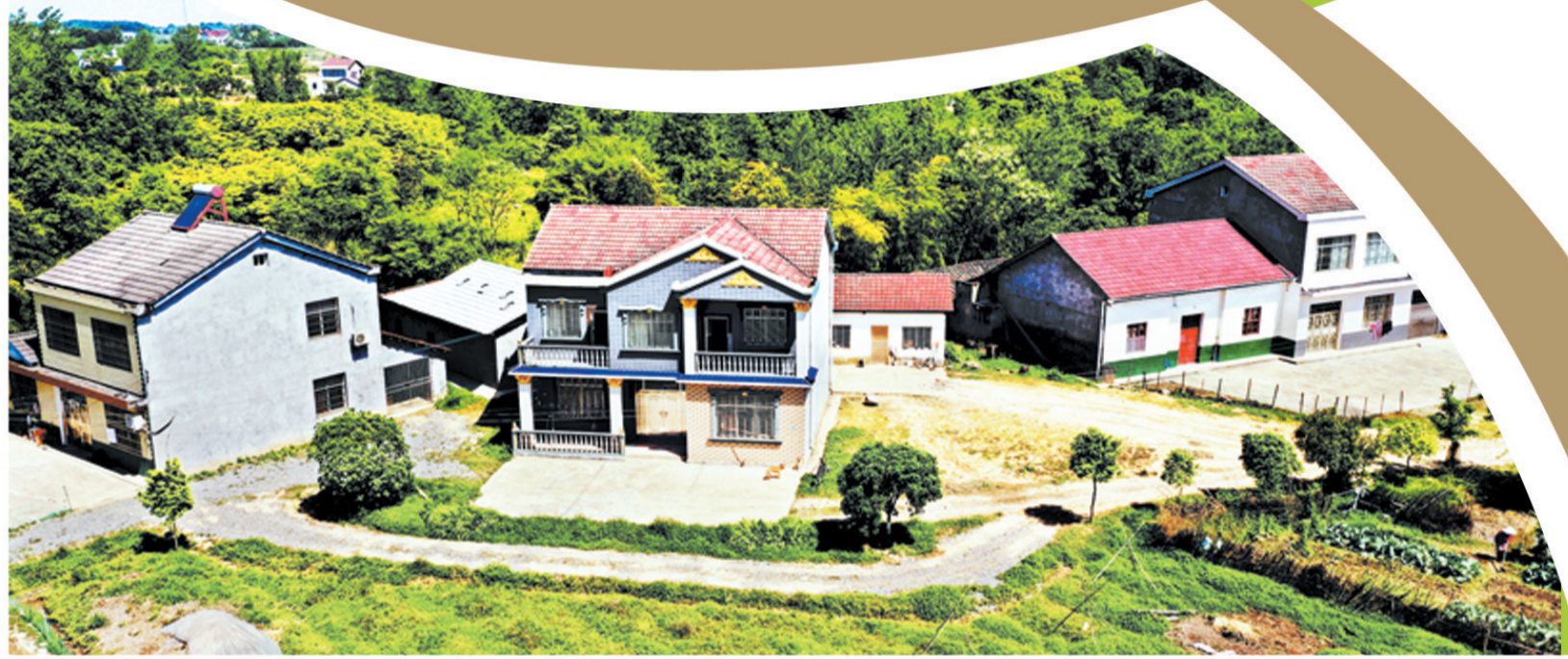
环境优美的农家庭院。