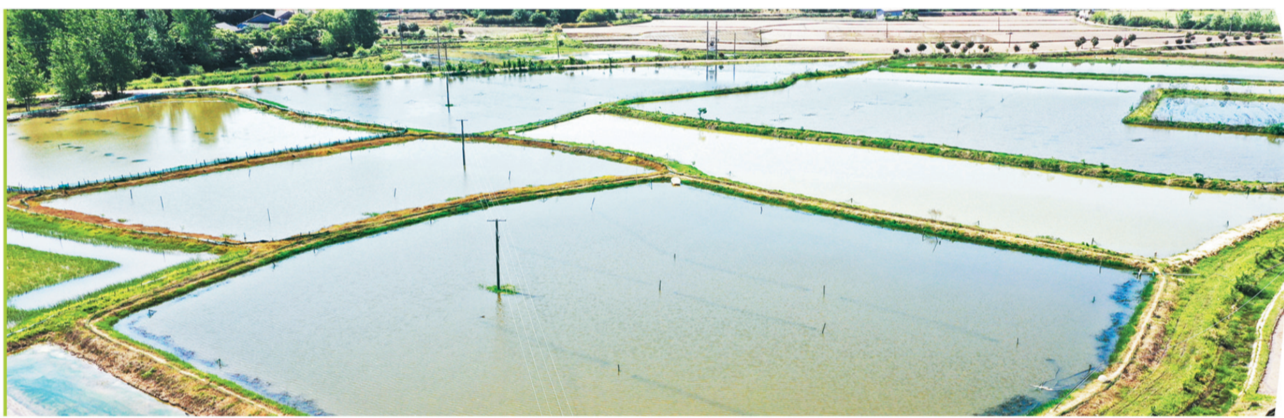
虾稻联作,带来村民生活好光景。

近年来,松滋市杨林市镇黄石岗村巧借乡村振兴东风,持续推进产业发展,不断提升村容村貌,让农民在稳定增收中感受幸福生活,生态黄石岗、美丽黄石岗、宜居黄石岗深入人心。生活在这里的每一位村民都感到满满的幸福。这种幸福,不光来自于经济收入的提高,更是打心眼里的自信和满足。