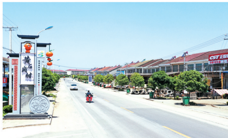
人居环境令人心旷神怡。

农业强不强,农村美不美,农民富不富,决定着全面小康的成色和社会主义现代化的质量。如今,梦想已经照进现实。经过农村人居环境整治、乡村道路基础设施改造提升等一系列惠农工程,黄石岗村环境日新月异,产业向好发展,农民生活水平稳步提高,一幅山青水绿、安居乐业的壮丽画卷正在徐徐展开。为了人民对美好生活的向往,黄石岗村两委班子凝心聚力,不懈奋进,正在筑梦小康的路上擘画更加美好的蓝图,创造更加壮丽的辉煌。