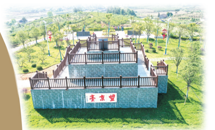
望京台与宜人景色融为一体。