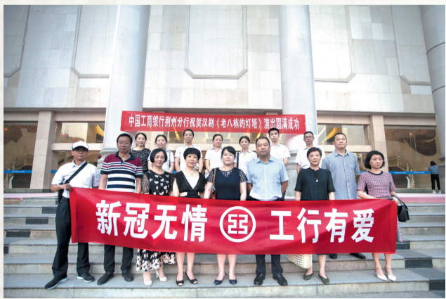
工商银行荆州分行组织员工观看现代汉剧《老八棵的灯塔》。