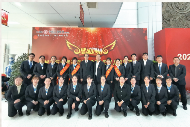
工商银行荆州分行全程参与“感动荆州”活动。

“十三五”期间,工商银行荆州分行各项存款累计增幅49.05%,各项贷款累计增幅85.8%,五年累计投放各项贷款609.3亿元。2020年拨备前利润是2015年的1.85倍。2020年末,新增存贷比73.92%,余额存贷比72.07%,比2015年末提高14.25个百分点。工商银行荆州分行连续多年被评为全市金融工作先进单位,先后有20名同志被评为全市金融工作先进个人。