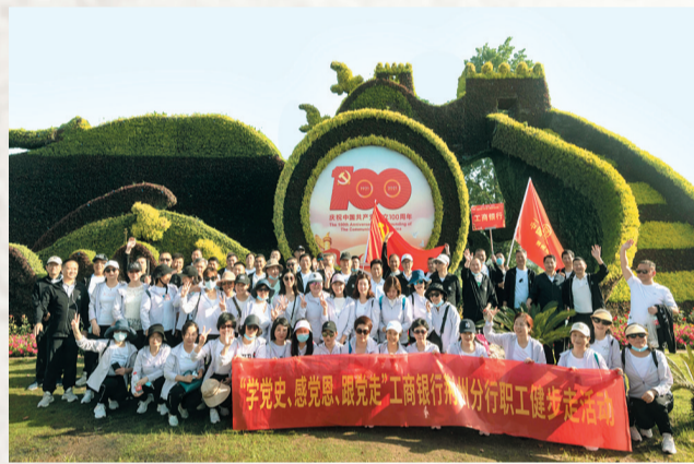
工商银行荆州分行干部职工参加园博园“学党史、感党恩、跟党走”职工健步走活动。