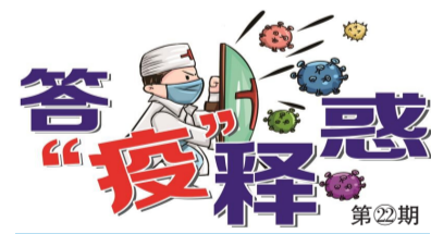
本栏目由市卫健委协办

新冠疫苗说明书中的禁忌要求孕妇、哺乳期妇女不得接种。因此备孕妇女须在疫苗接种后适当推迟怀孕时间,参考其他灭活疫苗,建议在接种3个月以后怀孕。