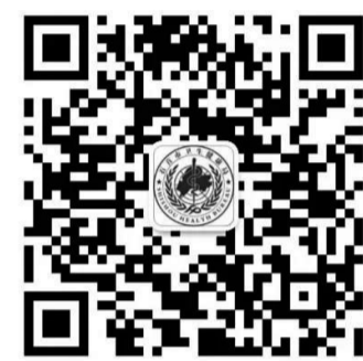
广大市民朋友预约接种新冠病毒疫苗的二维码

石首市卫生健康局推出了新冠病毒疫苗预约接种微信小程序,有意愿接种第一剂次和第二剂次的市民朋友均可网上预约。具体流程如下: ①微信搜索“健康石首”小程序或者直接扫码进入 ②首页添加就诊人完成实名认证 ③选择疫苗种类 ④选择对应的接种门诊 ⑤选择接种日期 ⑥预约完成。 石首市新冠肺炎防控指挥部 2021年7月13日