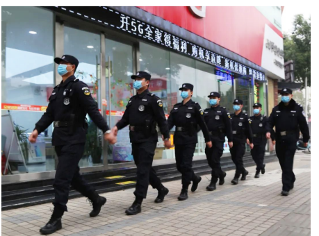
民警上街巡逻确保节日平安。