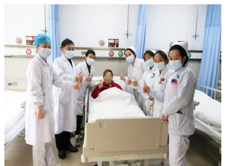
医护人员守护生命不停歇。