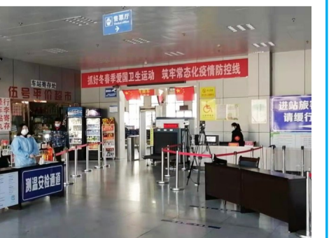
交通干部职工护航春运旅客平安出行。