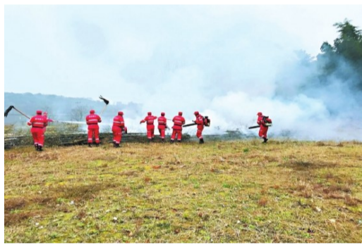
森林防火灭火训练。