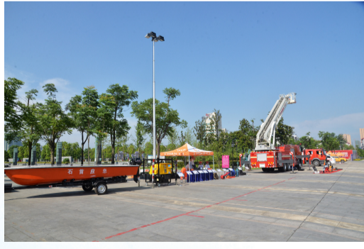
应急救援设施设备齐全。