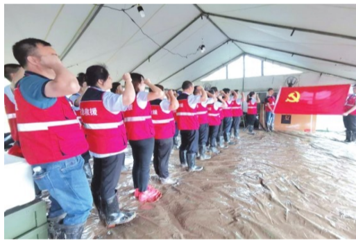
全局党员干部在防汛一线开展主题党日活动。