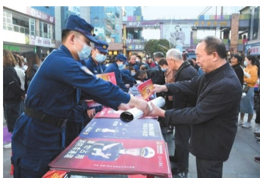
开展安全知识宣传。