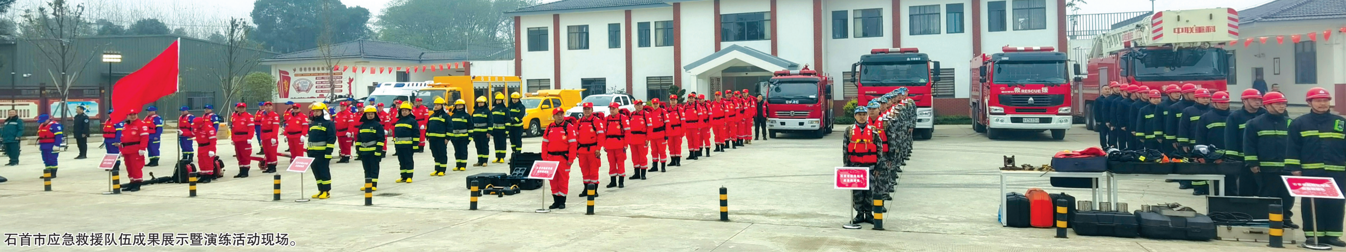
石首市应急救援队伍成果展示暨演练活动现场。