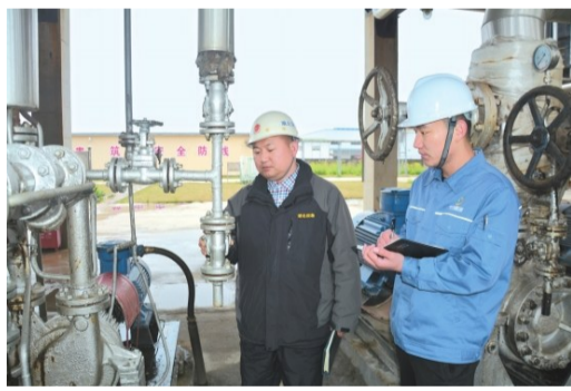
执法人员检查鑫洲新安全生产工作。