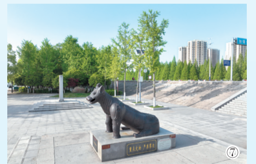
图①绿色屏障 (熊忠国 摄) 图②荆江风情带 (李德力 摄) 图③荆江江陵段最美堤顶公路 (樊孝银 摄) 图④洪湖长江段绿意浓 (王欣 摄) 图⑤岸清水碧美荆江 (孙杨 摄) 图⑥长江故道四月天 (肖杨 摄) 图⑦江陵镇江铁牛 (樊孝银 摄)