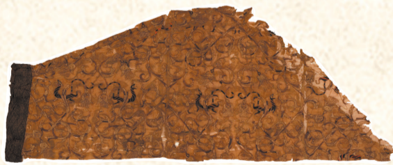
龙凤虎纹绣罗单衣(局部)