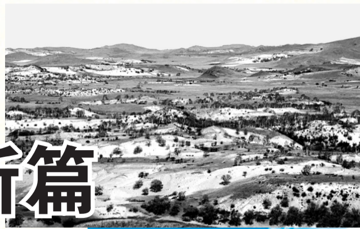
把荒漠变绿洲,塞罕坝创造了人间奇迹。