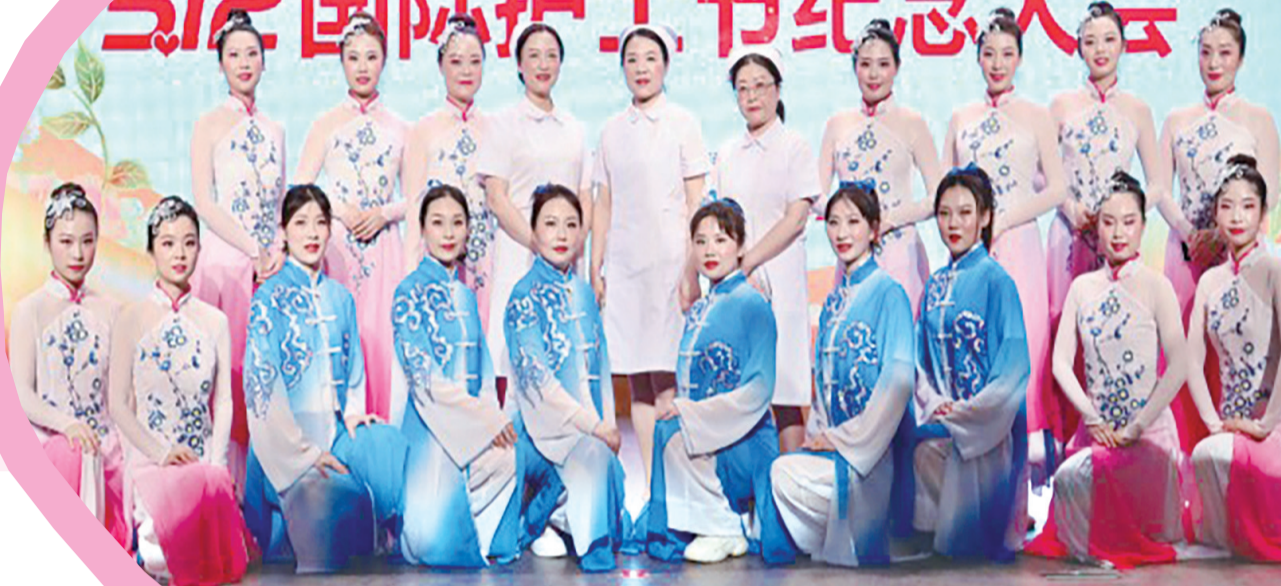
市卫生健康系统“5.12”国际护士节纪念大会活动现场。