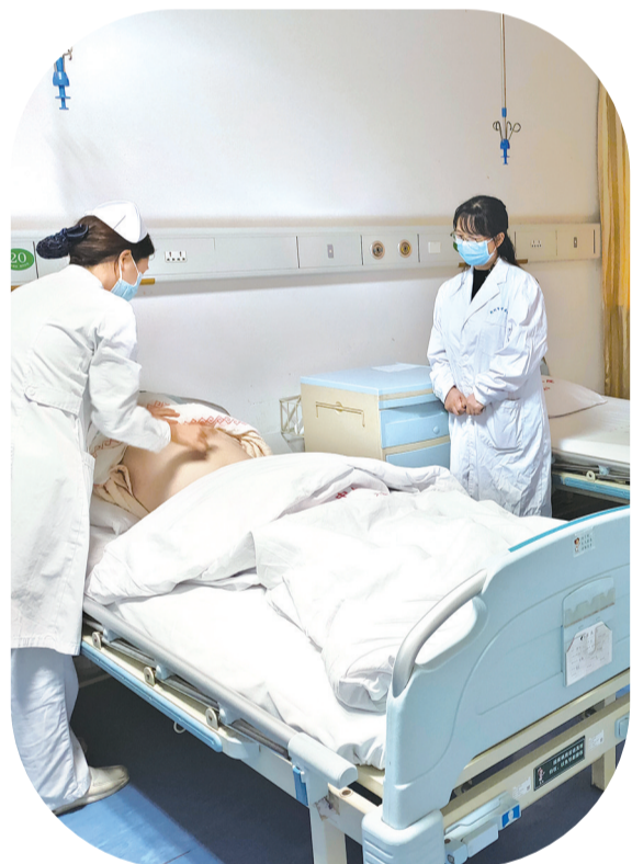
重点专科创建现场评审。