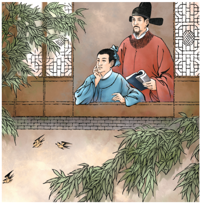
④杨溥叮嘱教育儿子终生不忘这“十戒”,并且要让这“十戒”传给子孙,世代遵守。