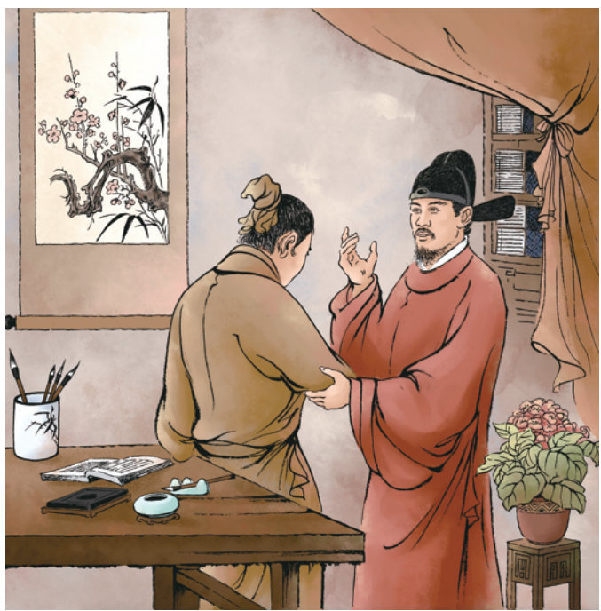
①正統六年,杨溥在回乡省墓时,看到回老家后的儿子心灰意冷,弃田抛荒,无所事事。