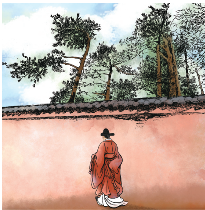
⑥杨溥不仅自己清正廉洁,而且还积极以自己的言行影响别人,把清正廉洁作为知人善任的一个重要准则。