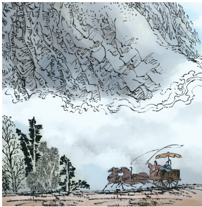
③皇帝为加强中央集权,巩固统治,经常会派自己的心腹太监到地方探查。