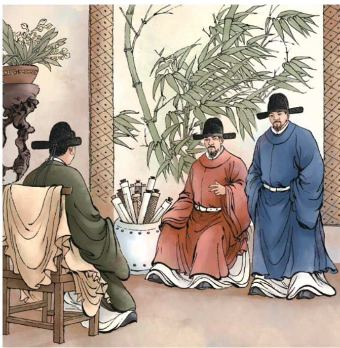
③这“十戒”从待人接物、立身持家等方面开始,为杨氏后人树立了良好的家风家训。