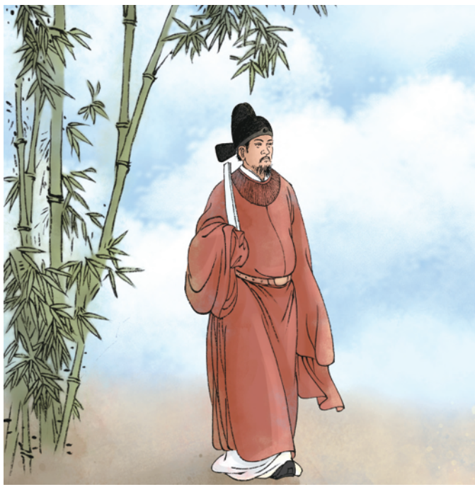
⑥杨溥一生修身严、律己严、用权严。干干净净做事,清清白白做人,被后世称为“一代贤相”。