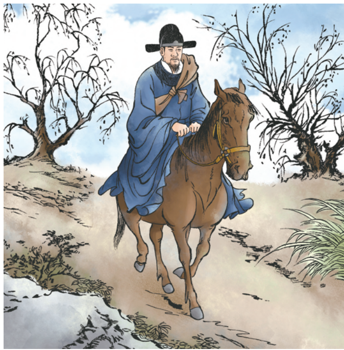
②刘永清,石首人,晚杨溥11年考中进士,同朝为官,后晋升为侍讲、广东布政使,成为镇守一方的朝廷要员。