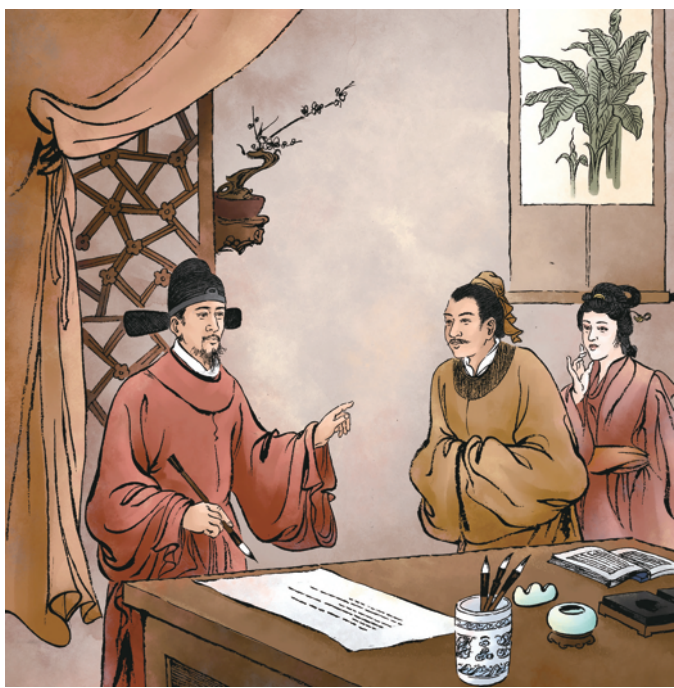
②于是,杨溥给儿子写下了杨家家训“十戒”。鞭策儿子在恶劣环境中更要自强自立。