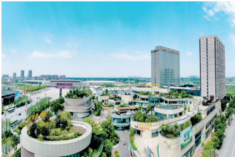
荆州城市立体绿化形成景观。