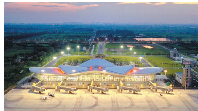
荆州沙市机场航站楼华灯初上。