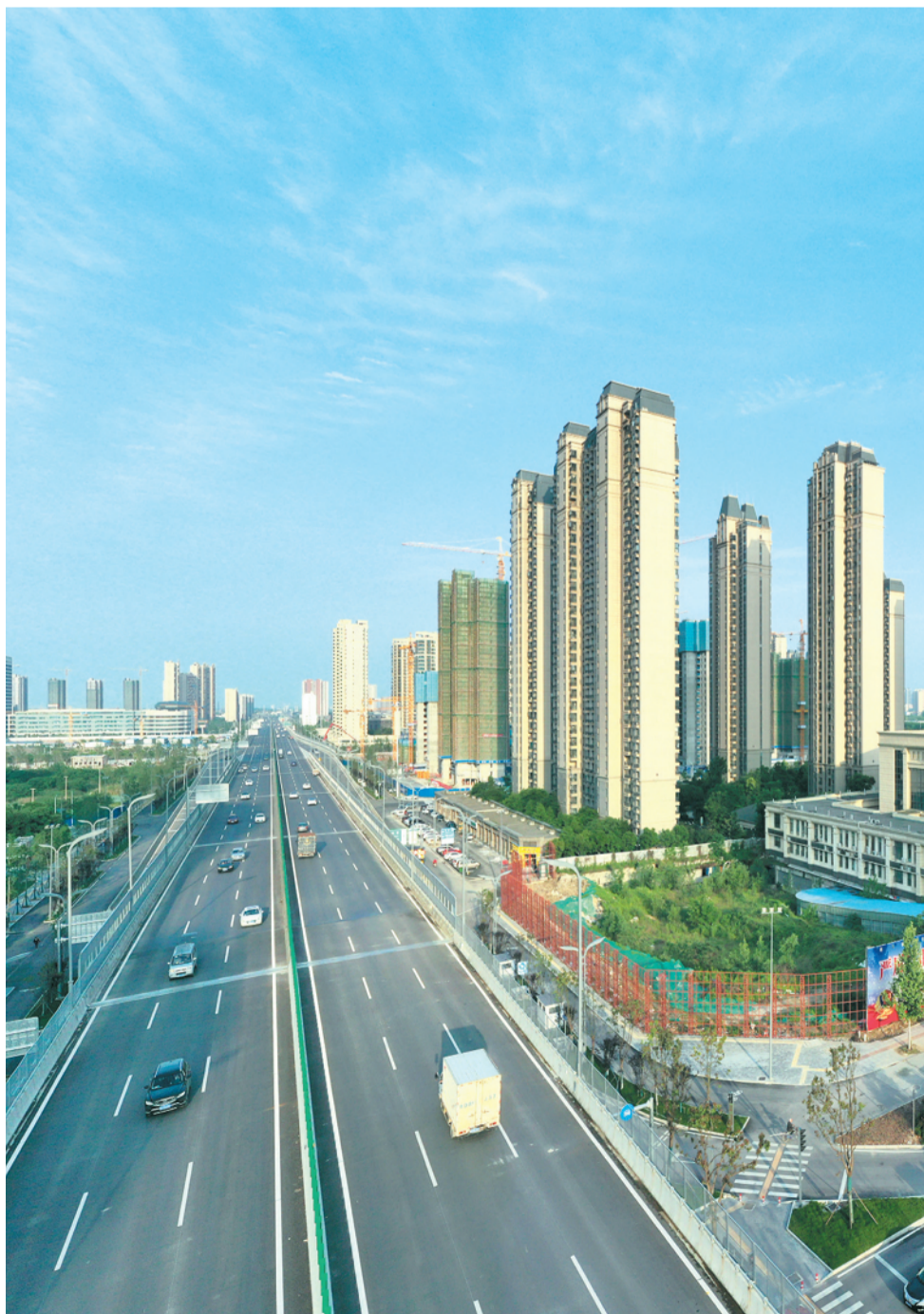
复兴大道横贯东西。