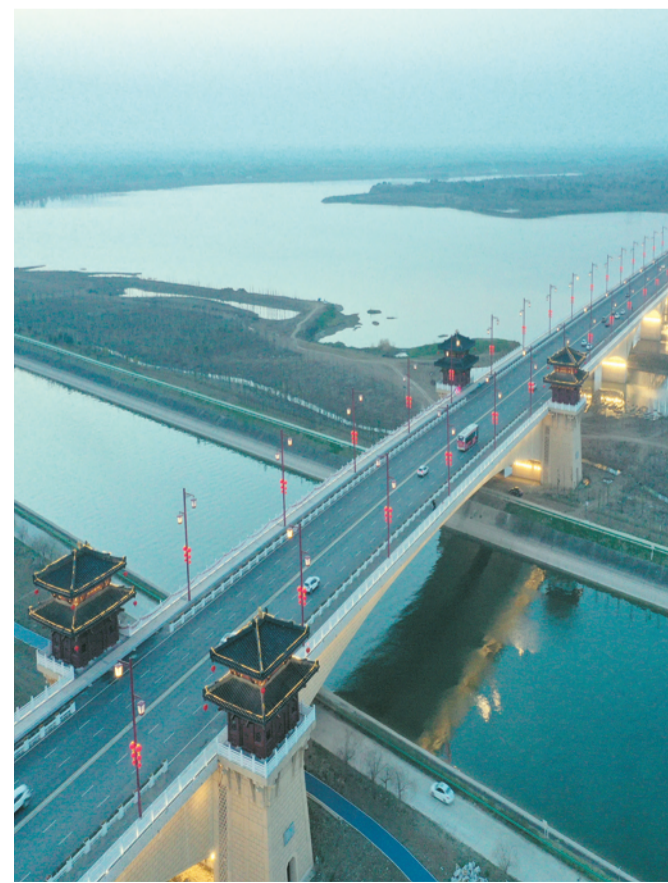
黄昏时分的凤凰大桥。