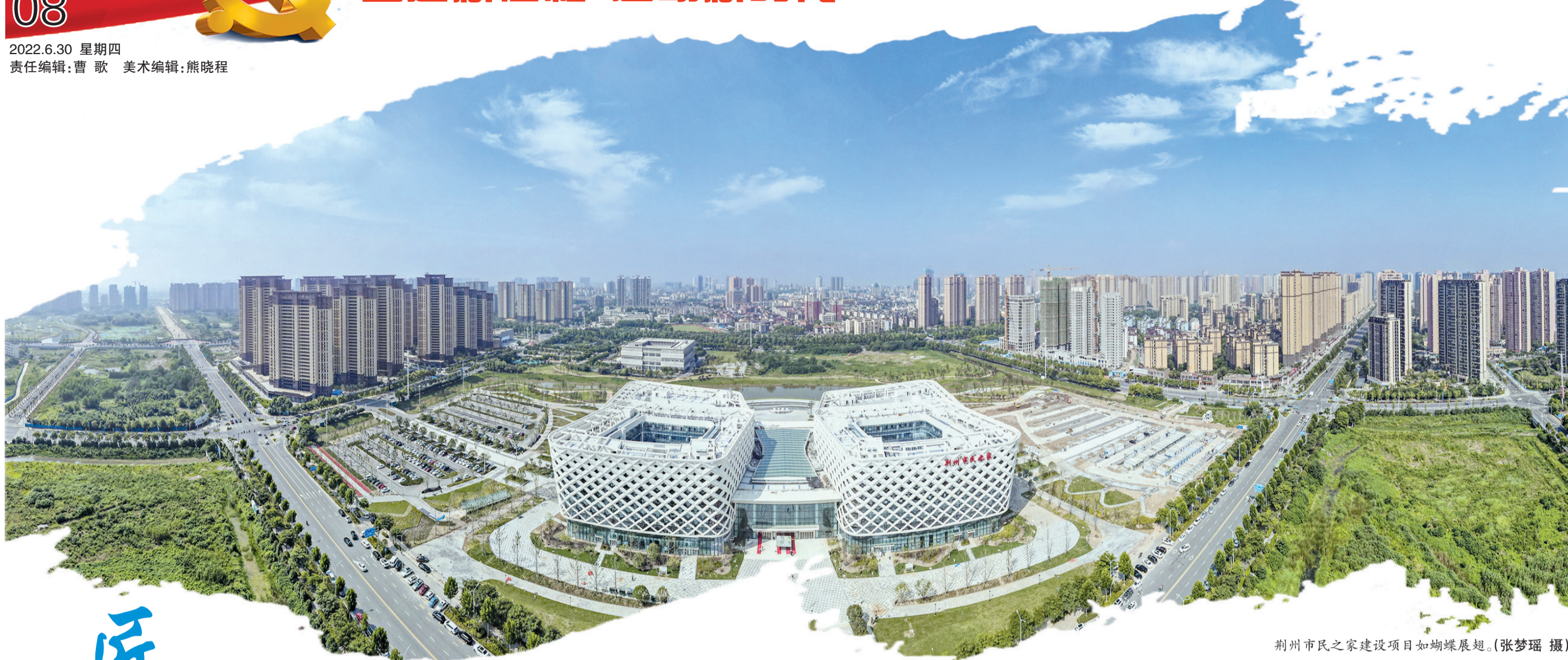
荆州市民之家建设项目如蝴蝶展翅。