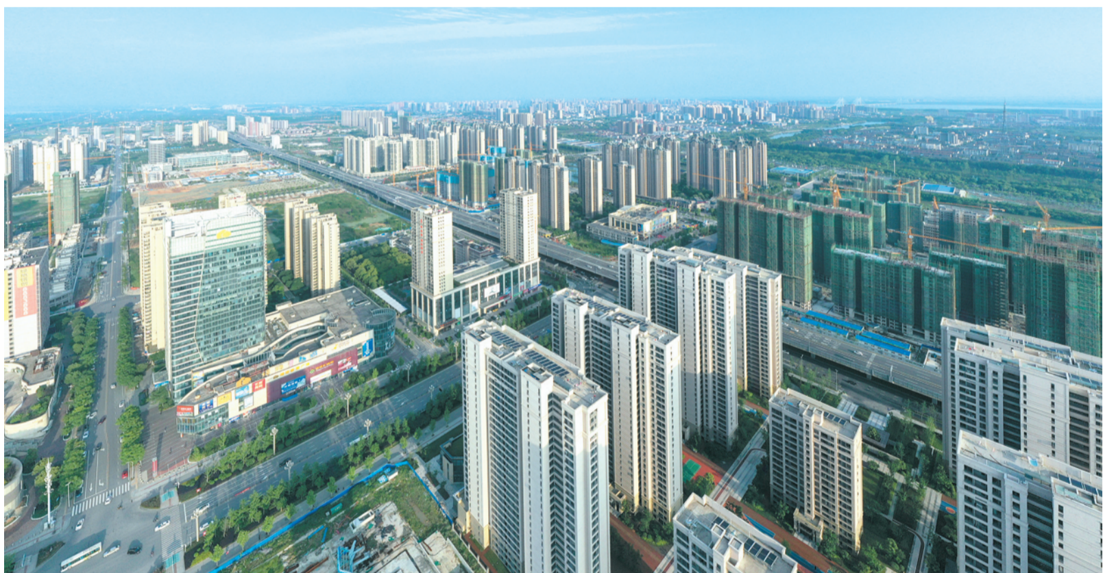
荆北新区日新月异。

如今，从住有所居到宜居、优居，荆州民生保障网越织越广、越织越密，这片底蕴雄浑的土地，正迸射更加耀眼的光芒。