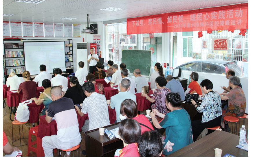
健康科普知识讲座。

本报讯(记者刘洁 通讯员张江江 严阔)为进一步提高和增强居民的健康观念和防病意识,切实做好党员干部下基层、察民情、解民忧、暖民心实践活动,近日,荆州市胸科医院联合沙市区解放街道武德路社区开展“下基层察民情解民忧暖民心——健康巡讲进社区”活动。