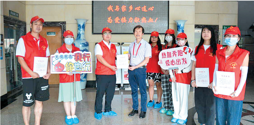
荆州籍大学生参与无偿献血活动。

团市委相关负责人表示,希望广大青年学生踊跃加入到我市无偿献血志愿者队伍中来,以实际行动为急需输