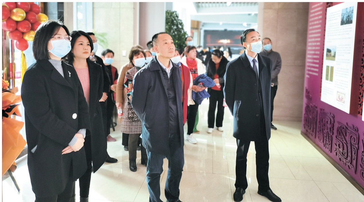
湖北银行荆州分行建立“省级金融教育示范基地”。

该行对受疫情影响较重的受困市场主体主动对接帮扶让利,对受困的普惠型小微企业主动对接降低融资成本,按程序审批差异化定价方案,将政策性银行转贷款优先满足普惠小微贷款投放,进一步降低企业融资成本。同时,主动承担小微企业贷款抵质押评估费、登记费、保险费,减免小微企业开户费、跨行转账汇款手续费。对疫情影响较