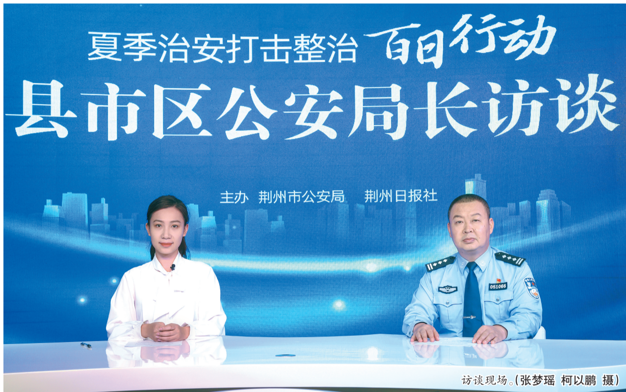
主办 荆州市公安局 荆州日报社

为持续打造最优法治化营商环境,高新区公安立足辖区经济高质量发展需要,积极构建全时空维护安全、多角度优化便民服务工作机制,探索“一企一警”和“园区110”机制,延伸管理和服务的触角,努力做到企业发展到哪里,公安工作就主动服务到哪里。荆州高新区公安分局成立