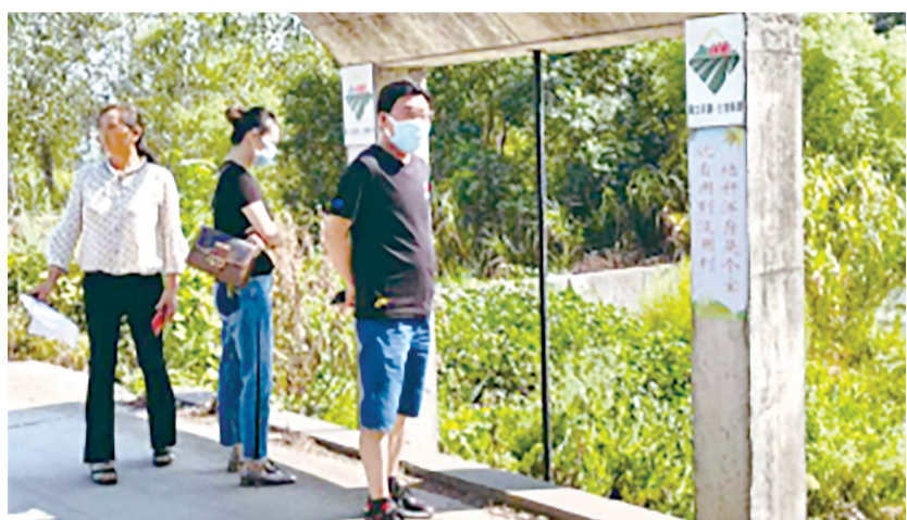
设在监利支公司党支部的企业帮扶专班到企业开展“十问十帮”走访活动。

人保财险荆州市分公司立足新发展阶段,做好新时代新阶段的人民保险工作,党员干部坚持政治过硬、信念过硬、能力过硬、作风过硬、责任过硬的“五个过硬”标准,自觉践行“以人民为中心”的发展思想,毫不动摇地坚持和完善党对经济工作的全面领导,坚定拥护“两个确立”,坚决做到“两个维护”,始终胸怀“两个大局”、心系“国之大者”,以实际行动践行“人民保险服务人民”的责任与使命。