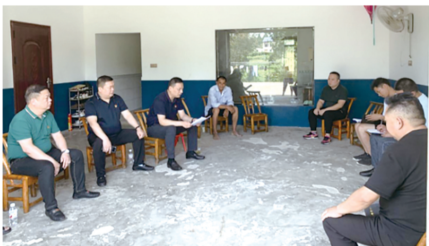
松滋支公司党支部组织党员干部到澧水镇后坪村开展蹲点式调研。