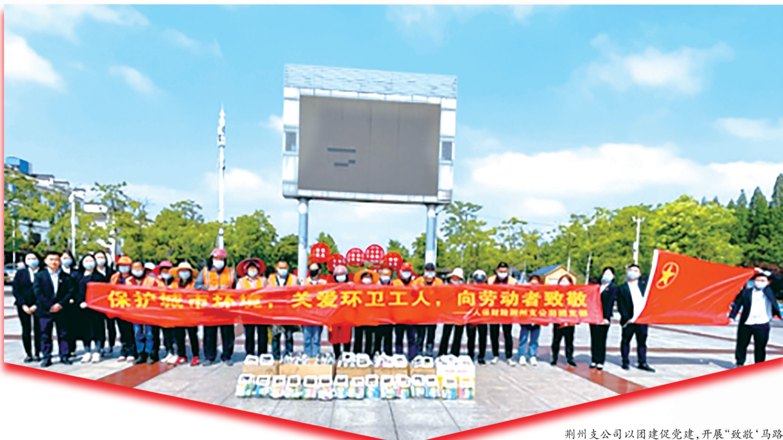
荆州支公司以团建促党建,开展“致敬‘马路天使’ 弘扬‘五四’精神”主题活动。