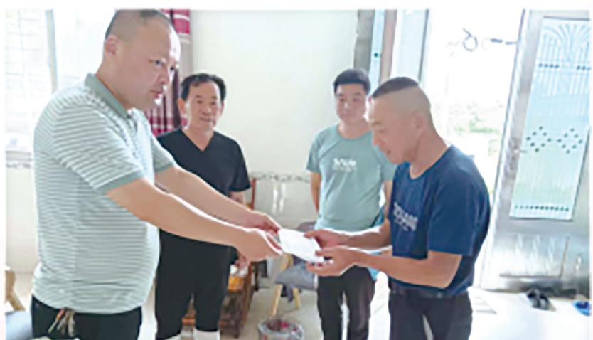
洪湖支公司党支部党员干部向红星河村七组困难村民捐款。