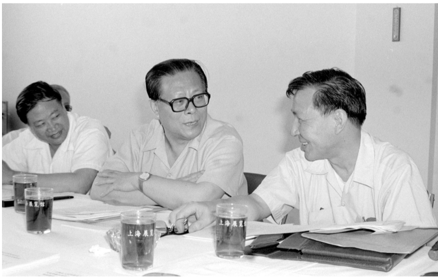
上图:1985年,江泽民同志在上海市八届人大四次会议上。