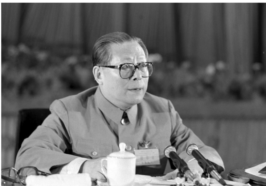
上图:1989年6月23日至24日,中国共产党第十三届中央委员会第四次全体会议在北京召开。这是江泽民同志在会上讲话。