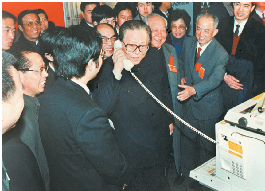
上图:1984年5月,江泽民同志在北京展览馆举行的全国电子新产品展览会上,试用国际长途电话向远方的工作人员问候。