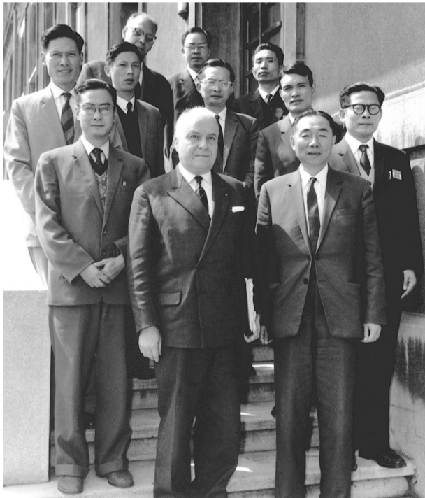
上图:1964年6月,江泽民同志(二排右一)在法国艾克斯莱班出席国际电工委员会会议期间与会代表合影。