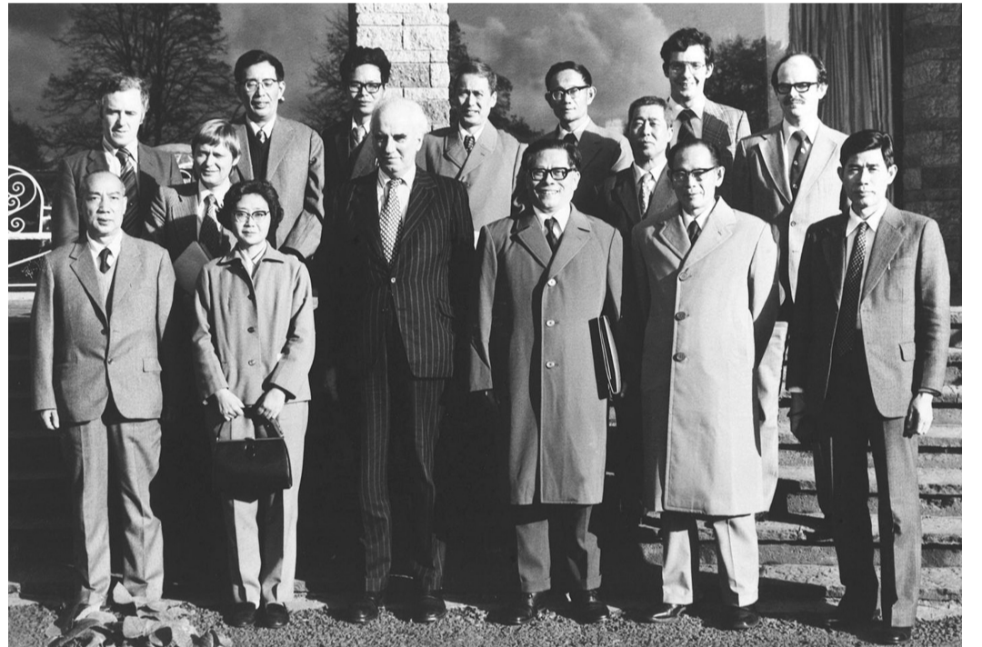
上图:1980年10月底,江泽民同志(前排右三)在爱尔兰香农开发区考察时同开发区负责人等合影。