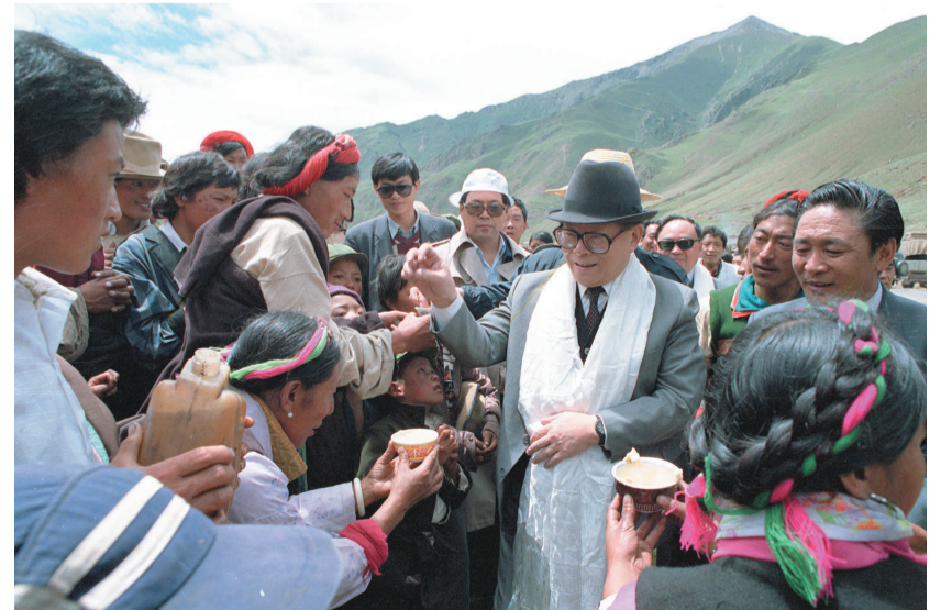
上图:1990年7月25日,江泽民同志与藏族群众共庆望果节。