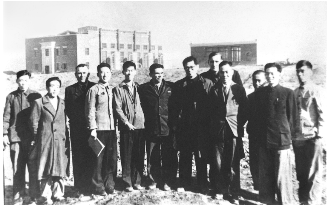
上图:1956年,江泽民同志(左七)在长春第一汽车制造厂同援建一汽的苏联专家等合影。