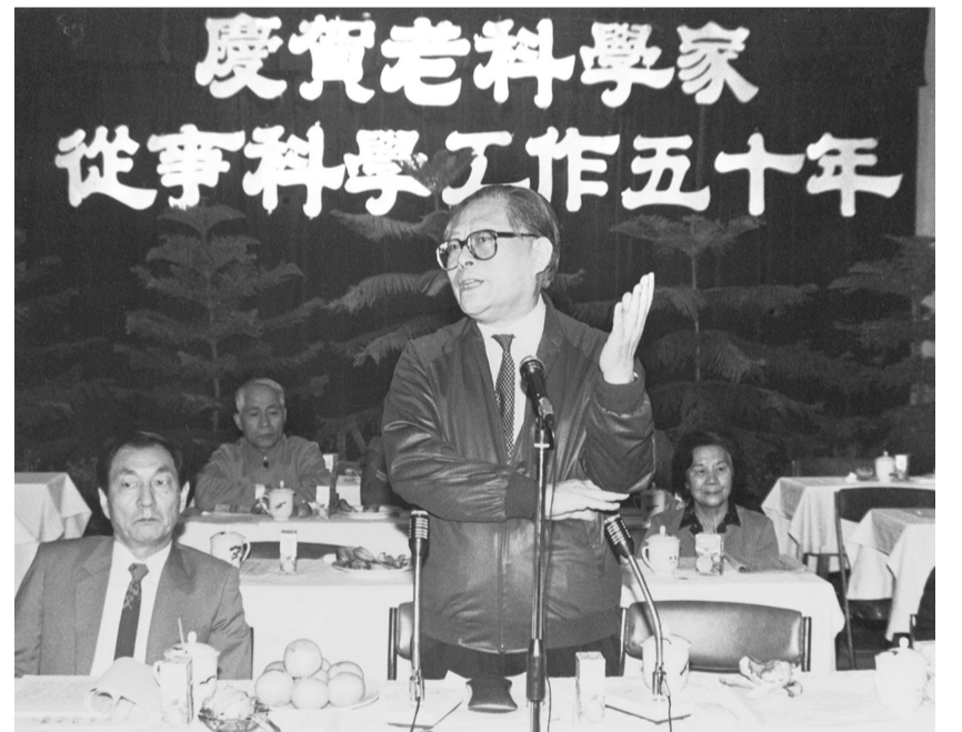
上图:1988年10月,江泽民同志在上海庆贺老科学家从事科学工作五十年座谈会上讲话。