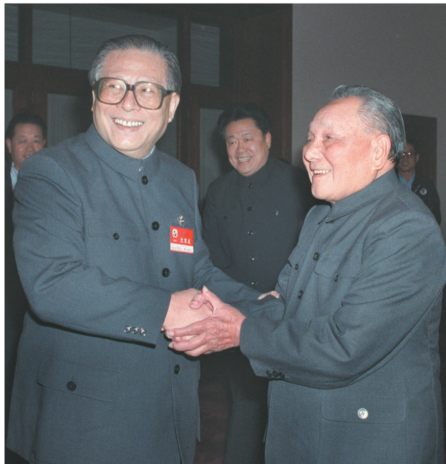
右图:1989年11月6日至9日,中国共产党第十三届中央委员会第五次全体会议在北京召开。这是邓小平同志和江泽民同志亲切握手。