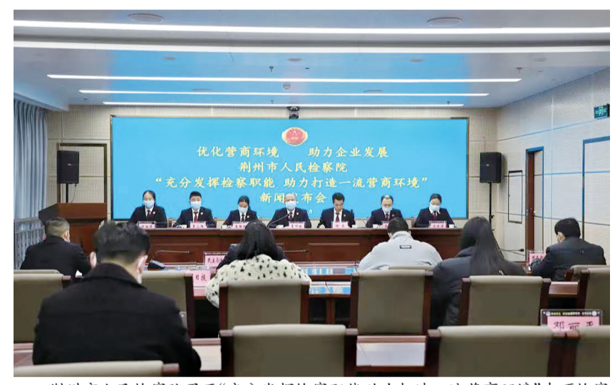
荆州市人民检察院召开“充分发挥检察职能助力打造一流营商环境”专项检察工作新闻发布会。

检察机关以企业合规“应用尽用”为前提,依法能动开展检察工作,充分发挥好提前介入、引导侦查、自行侦查