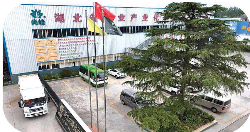
湖北尚峰食品有限公司食品项目在2022年全市第二季度固定资产投资拉练考评中位列第二名。