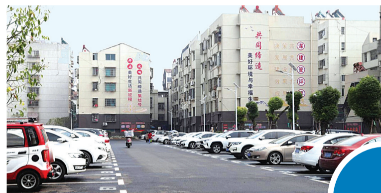
省级共同缔造活动示范点朝天口社区中实化工小区面貌焕然一新。