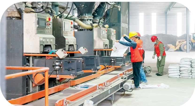
宏城新型建材有限公司砂浆生产项目在2022年全市第三季度固定资产投资拉练考评中位列第一名。