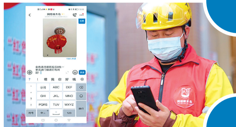
建北社区数字化社区的“蜂鸟效益”入选全省城乡社区治理十佳创新案例。