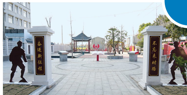
孙家拐社区红色文化广场。