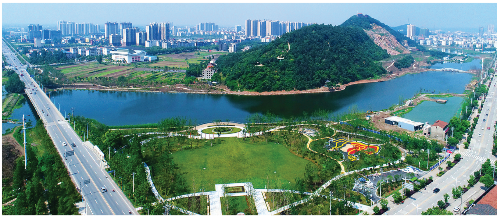
生态、和谐、秀丽的笔架山街道办事处。

2022年,笔架山街道办事处奋起赶超强经济,跑出了经济高质量发展的加速度;共同缔造惠民生,让居民切切实实感受到了社会治理的改善、城镇建设的提档、公共服务的升级、环境改善的美好、产业发展的蝶变、生活质量的攀升,在全力推进石首“三城三化三翻番”、加快建设县域经济高质量发展示范市中贡献出了笔架力量、谱写了笔架华章。