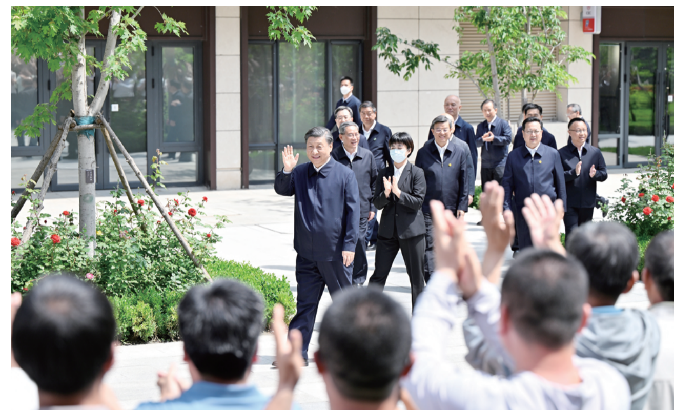
10日上午,习近平在容东片区南文营社区考察时向社区居民挥手致意。

车大厅、站外广场,了解雄安站建设运营和所在的管片片区规划建设情况。习近平指出,雄安站是雄安新区的交汇车站,要进一步完善联通雄安新区和雄安新区的交通“微细血管”,提升人流物流聚集和疏散的效率。要把管片片区建设成为高端高新产业集聚区,让各方来客一到雄安,就能感受到雄安新区扑面而来的现代化新气象。 习近平随后乘车来到容东片区南文营社区。该社区安置了安新、容城两县回迁群众5000多人。习近平先后来