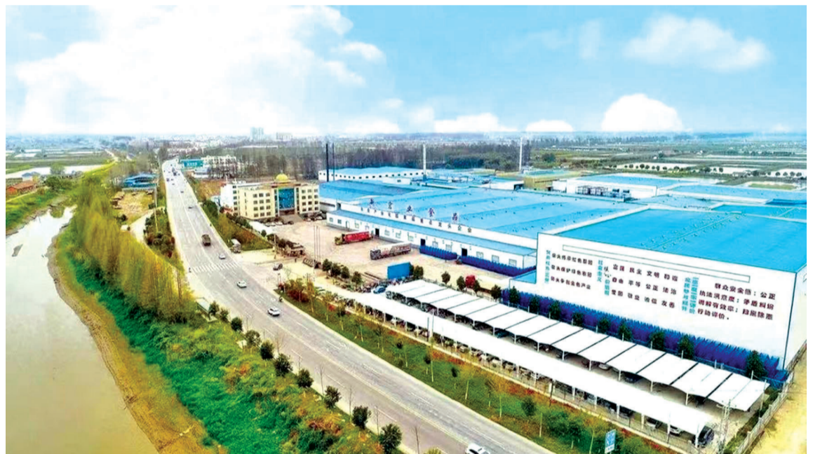
洪湖市新农业食品有限公司

未来之洪湖,优势集成、资源集中、动力集聚,将全面唱响预制菜品牌,为荆州打造华中预制菜之都赋能添彩。