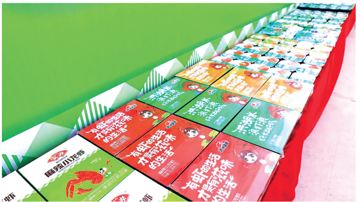
洪湖安井预制菜产品