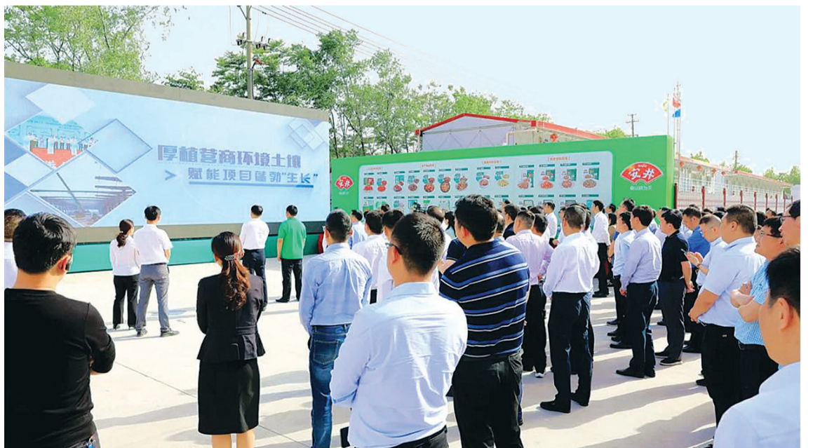
重大项目拉练活动走进洪湖安井预制菜基地