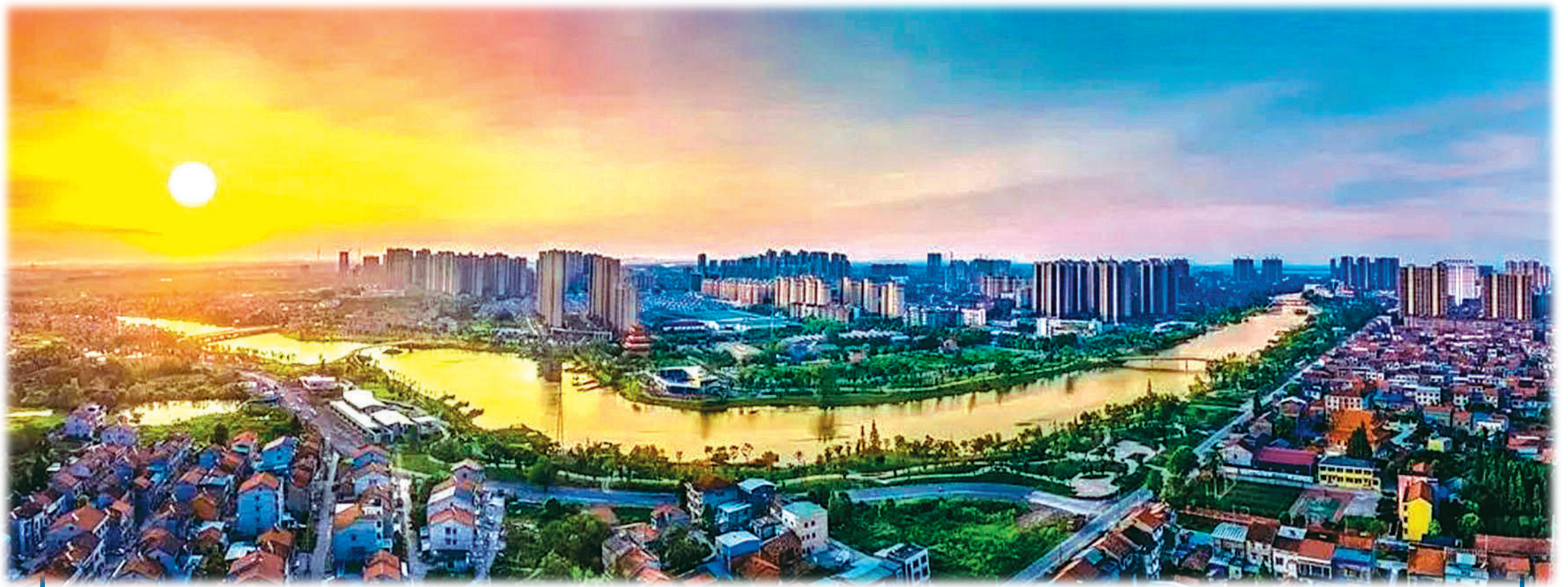
鸟瞰洪湖