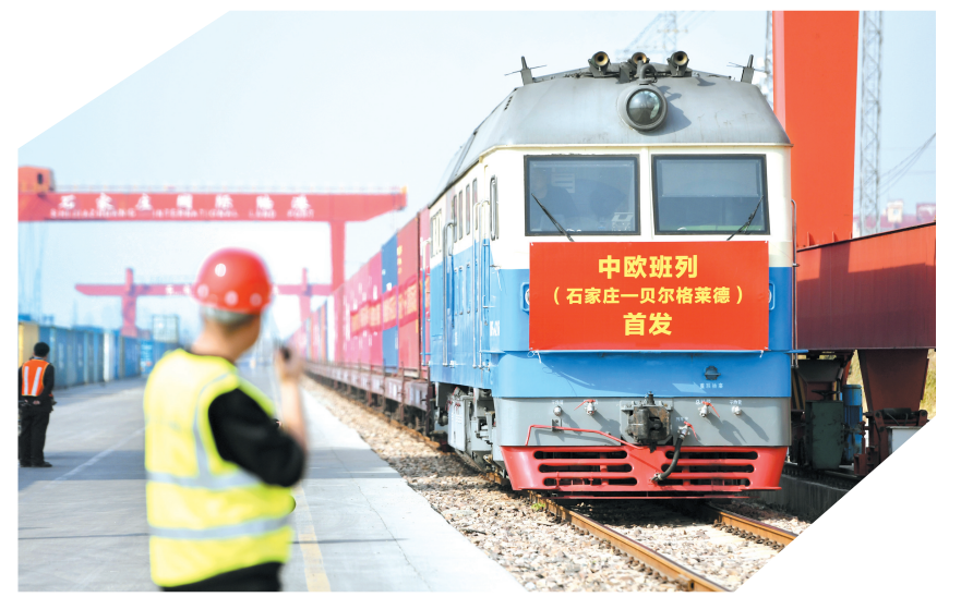
3月21日，驶往塞拉维亚的中欧班列从石家庄国际陆港驶出。

云海二号02组卫星主要用于大气环境要素探测、空间环境监测、防灾减灾和科学试验等领域。这次任务是长征系列运载火箭第513次飞行。