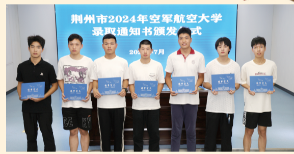
荆州市2024年空军航空大学录取通知书颁发仪式现场。

据悉,中国人民解放军空军航空大学是中国唯一一所培养飞行人才为主体、航空飞行指挥与航空工程技术专业兼容的综合性军事高等学府,被誉为“飞行员的摇篮”“英雄的摇篮”。招飞历来有着“选拔严、环节多、淘汰高”的特点,需要经过初检、复检和定选,政治考察,家访实地考察,同时还要通过体能、心理测试、思想品德考察等多个环节的层层筛选,文化课成绩更是优中选优。可以说,能考上空军飞行学员的学生,都是品学兼优、万里挑一的佼佼者。