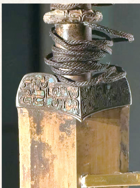
越王者旨赐剑（局部）

二〇二四年第三十七期 总第一百二十一期 知荆州 爱荆州 兴荆州 荆州市融媒体中心 荆州市委宣传部 荆州市文旅局 荆州市文联 联合出品