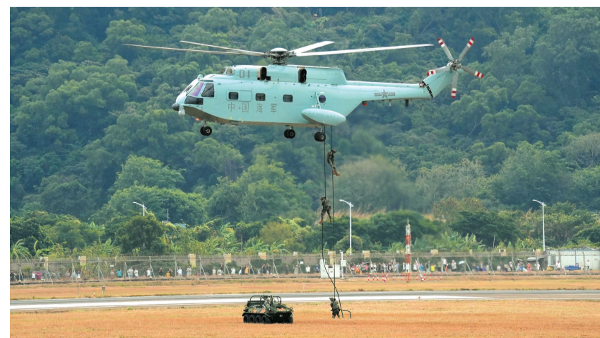
第十五届中国国际航空航天博览会将于11月12日在广东珠海开幕。11月10日,人民海军舰载直升机在广东珠海开展适应性飞行训练。

根据汛情通报,台风“银杏”10日10时中心位于海南省三沙市北偏东方向,约245公里,中心附近最大风力14级,预计将以每小时5至10公里的速度向西南方向移动。