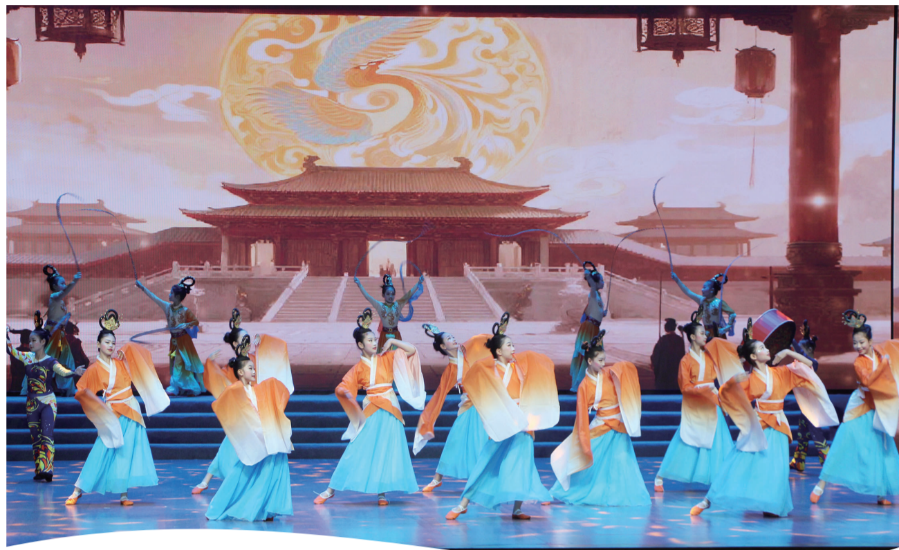
荆州开发区实验中学开场舞《兰佩摇风》。

从懵懂幼童到莘莘学子,从口传心授到数智融合,荆州少年以敬畏之心守护文化根脉,以创新之笔书写时代华章。