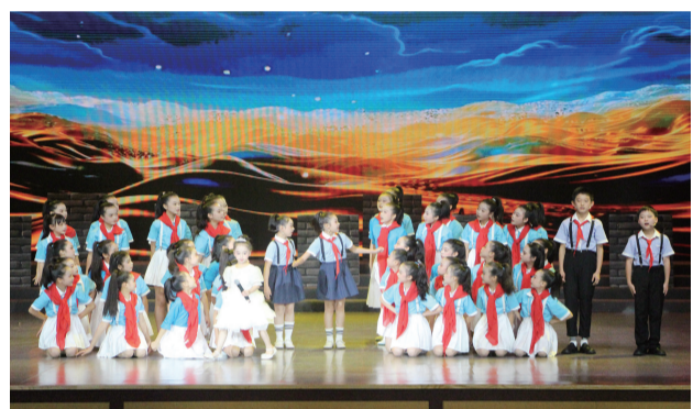
沙市北京路第二小学表演的节目《楚魂今何在》。