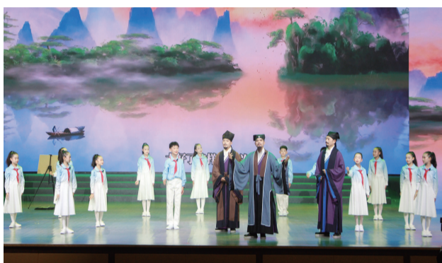
公安县竹溪小学表演的节目《柳浪湖畔的AI奇遇2》。

角,激励少年勇担传承使命。整场演出跨越时空的文明接力,又如奋进的号角,构建起一条传统与现代交织、代际与媒介共振的传承链,让楚文化血脉在新时代焕发永恒生机。