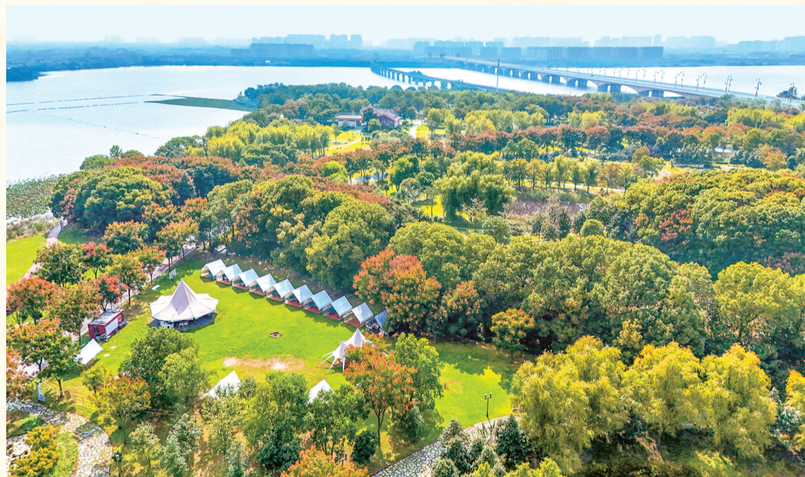
荆州园博园秋景宜人。