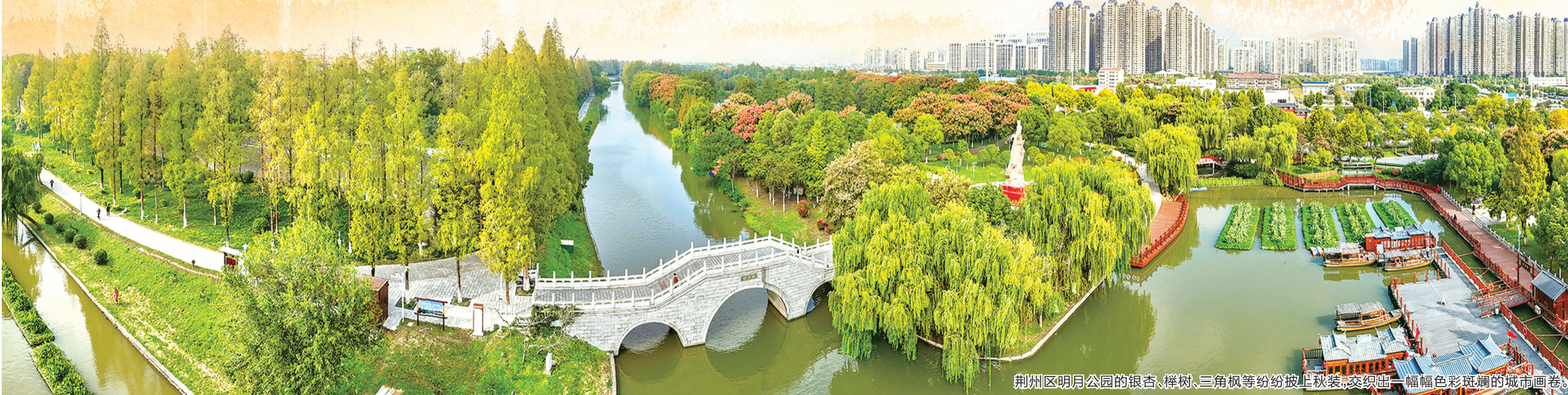
荆州区明月公园的银杏、榉树、三角枫等纷纷披上秋装,交织出一幅幅色彩斑斓的城市画卷。