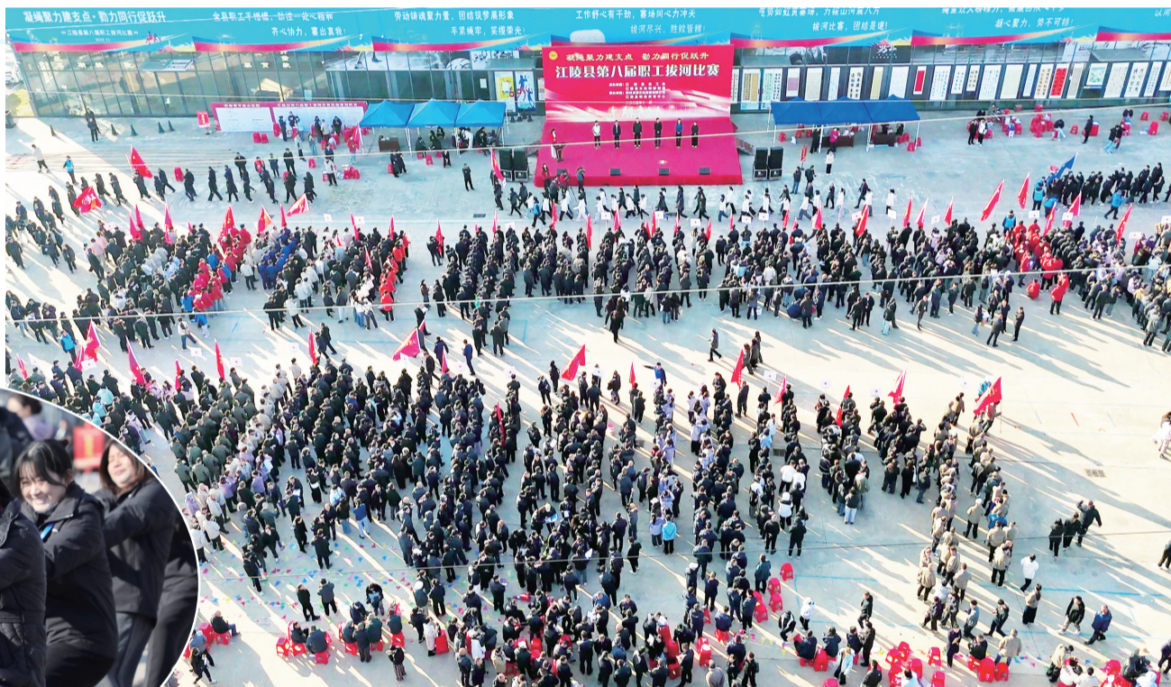
11月20日上午,江陵县第八届职工拔河比赛拉开帷幕,共有60个代表队、256支比赛队伍、3200多名职工参加,是近几年参赛队伍最多、人员最多的一次比赛。比赛中,各参赛队员团结协作、意气风发,展现出敢争敢拼的精神风貌。