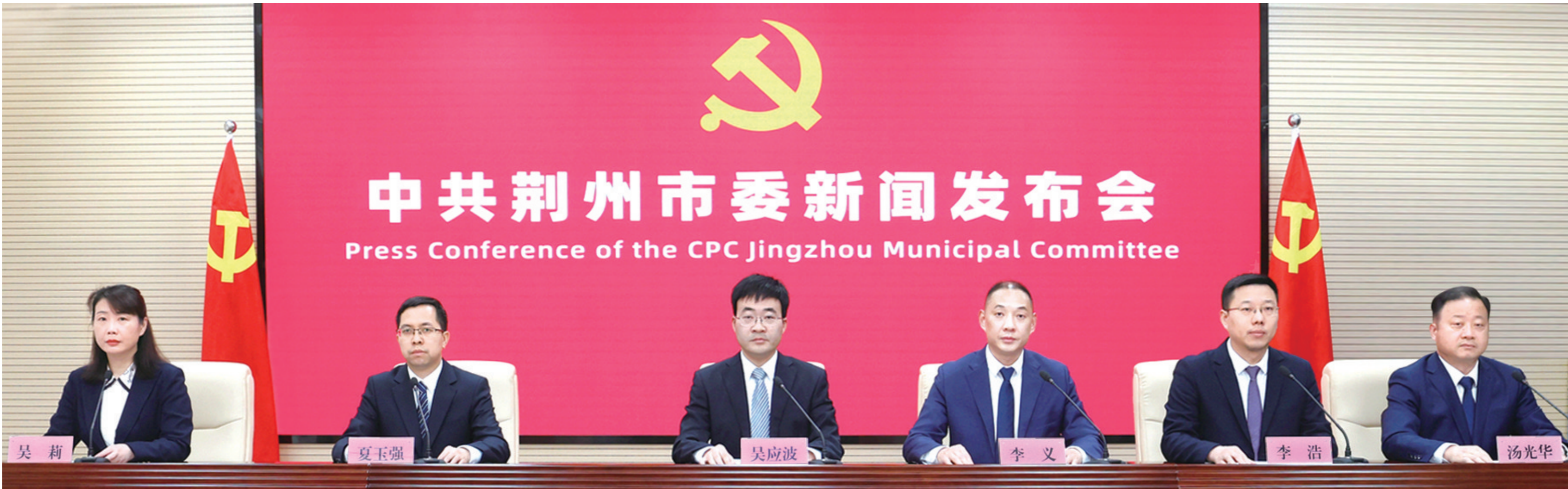
12月5日,中共荆州市委召开新闻发布会,介绍中共荆州市委六届十二次全会精神。