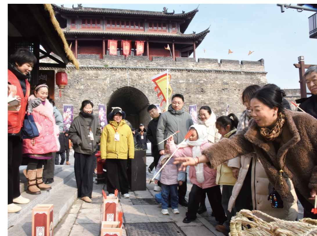
游客在荆州大北门“三国早市”,体验投壶、射子骰等游戏。