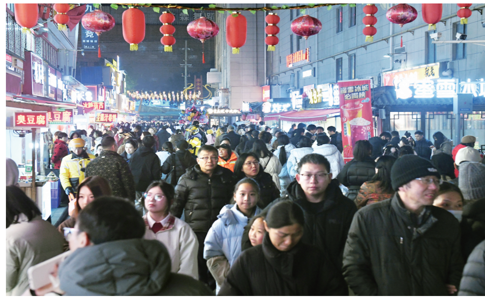
沙市区文豪巷美食街迎来客流高峰,人头攒动,美食飘香。