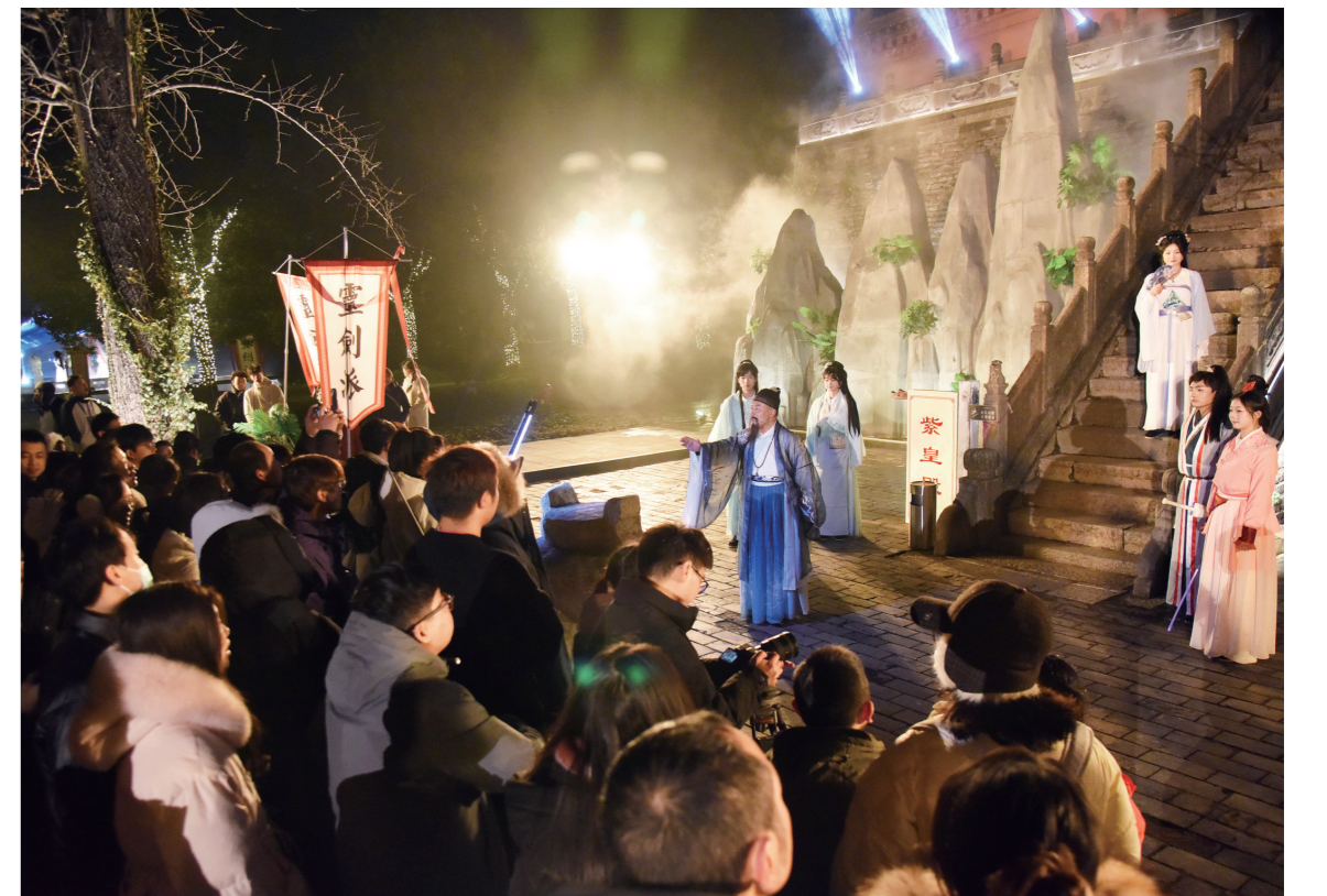
九老仙都景区开启灵剑山奇幻夜游活动,为游客带来沉浸式仙侠体验。