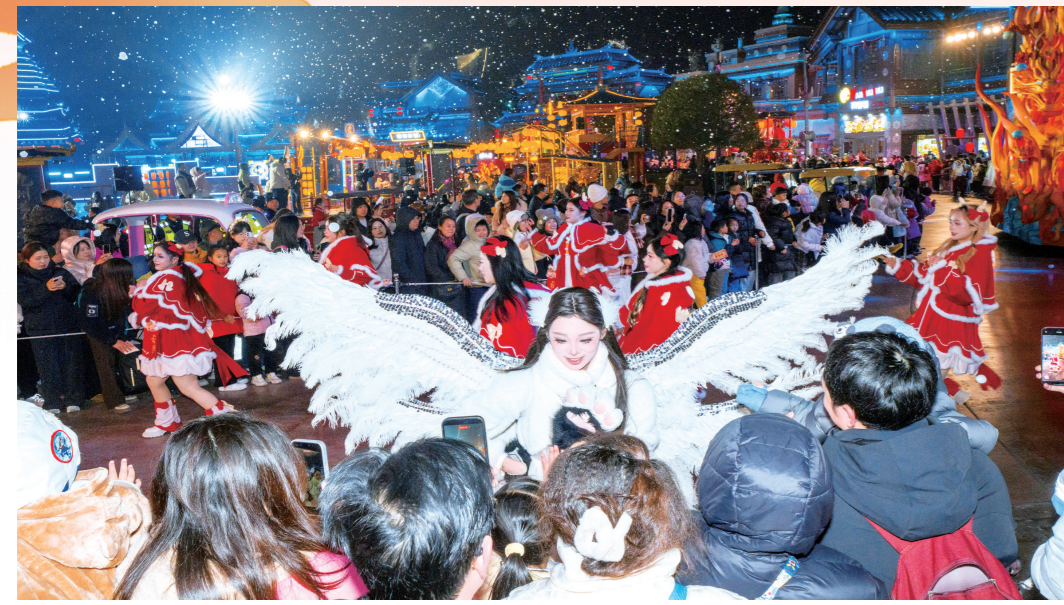
荆州方特奇幻角色与游客热情互动,将节日氛围不断推向高潮。