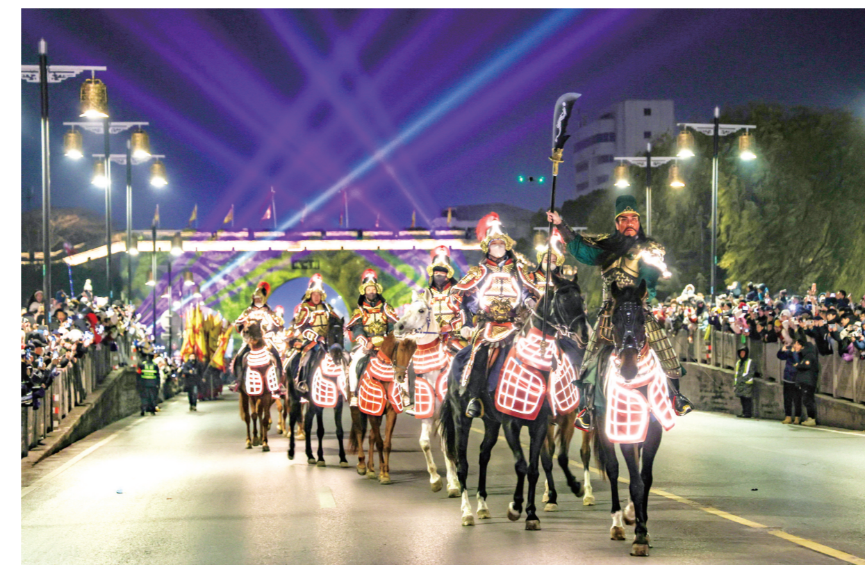
东门片区,“关羽”将军身披金甲,策赤兔宝马巡城的福。