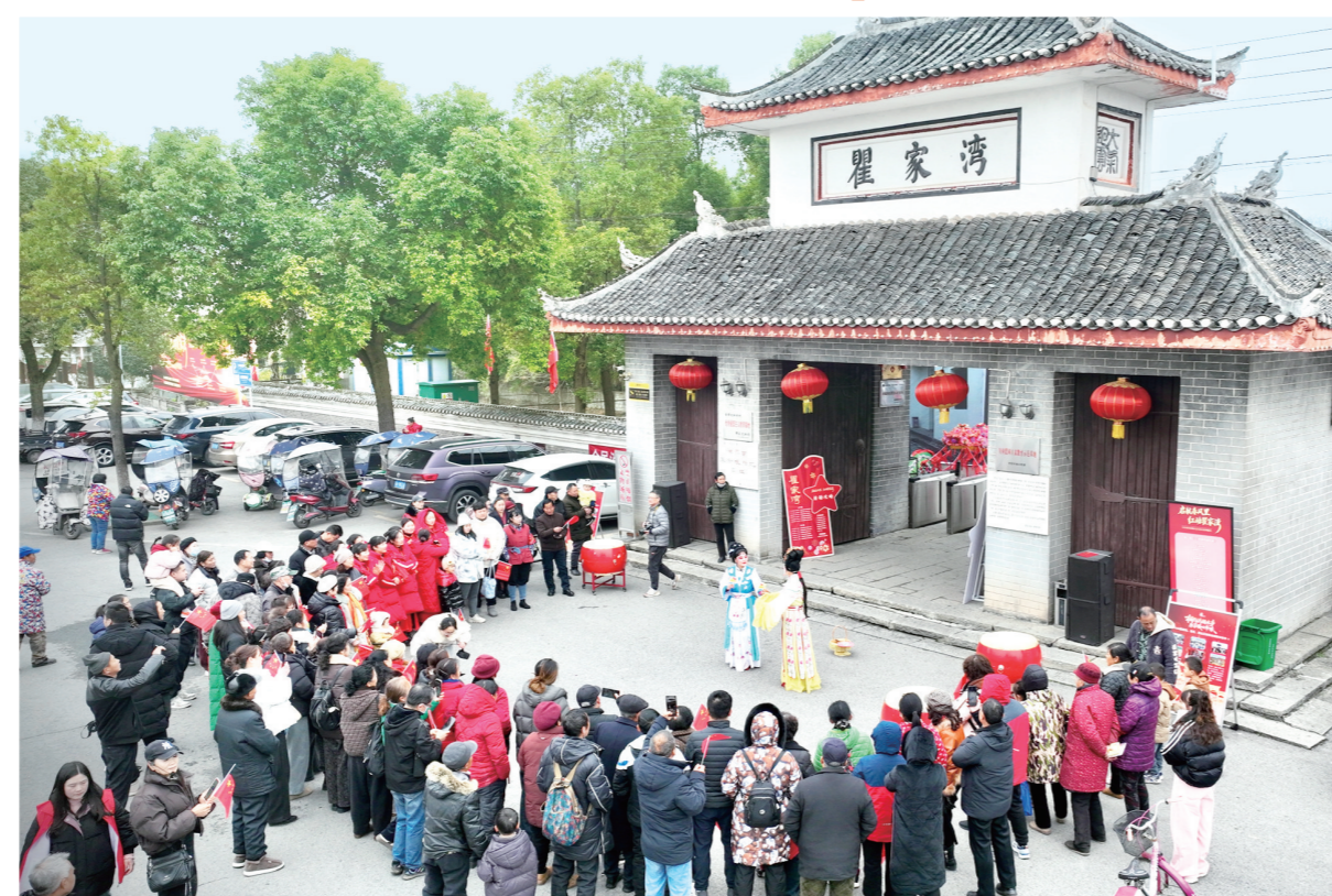
“启航春风里 红动瞿家湾”红色沉浸式系列演出,在洪湖市瞿家湾湘鄂西革命根据地旧址举行。