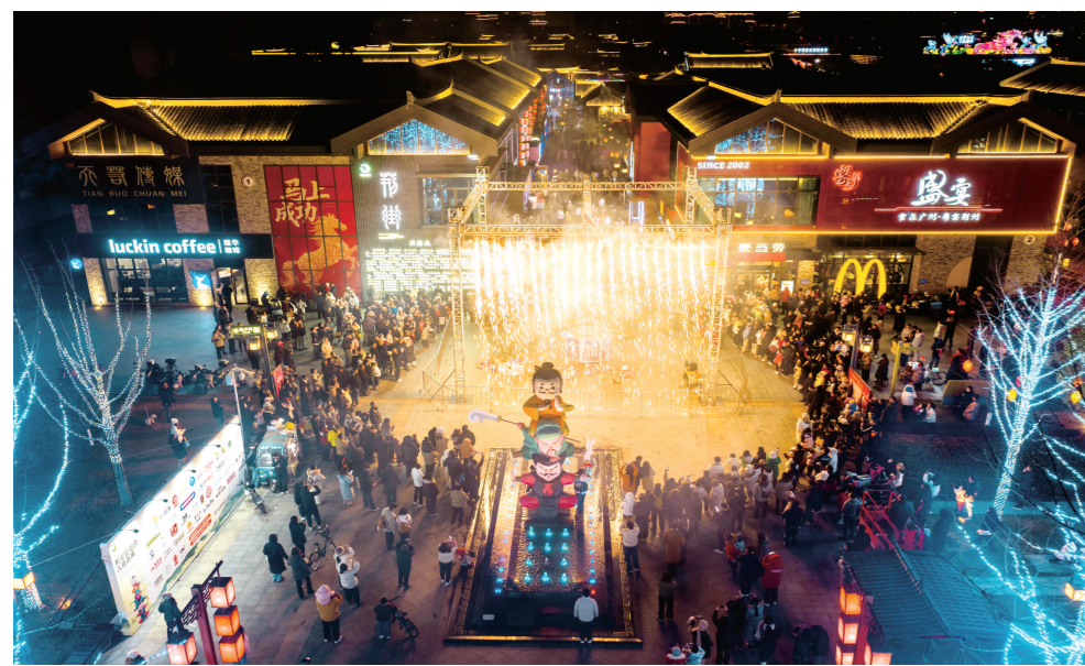
荆街三英广场上,“盛世花开”盒子灯层层绽放,流光溢彩,引观众赞叹。