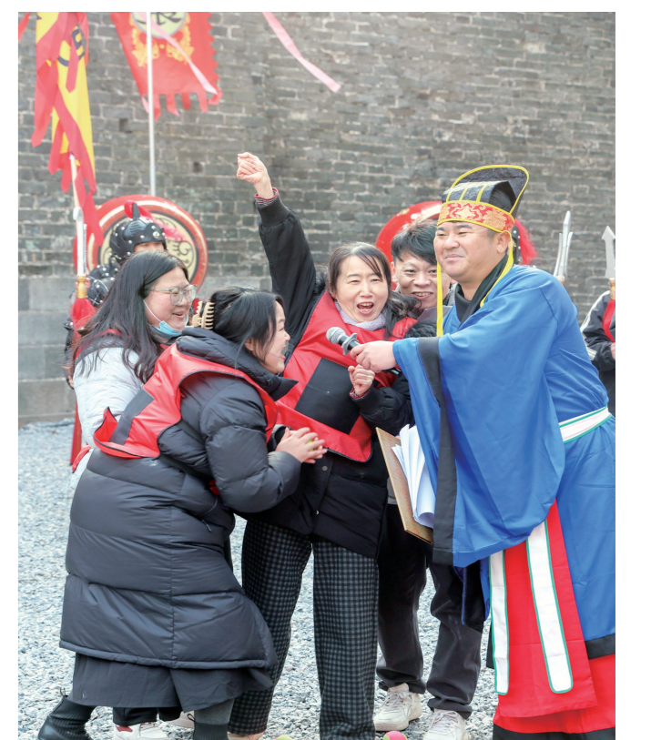
游客们积极参与“我在荆州演三国”互动环节。