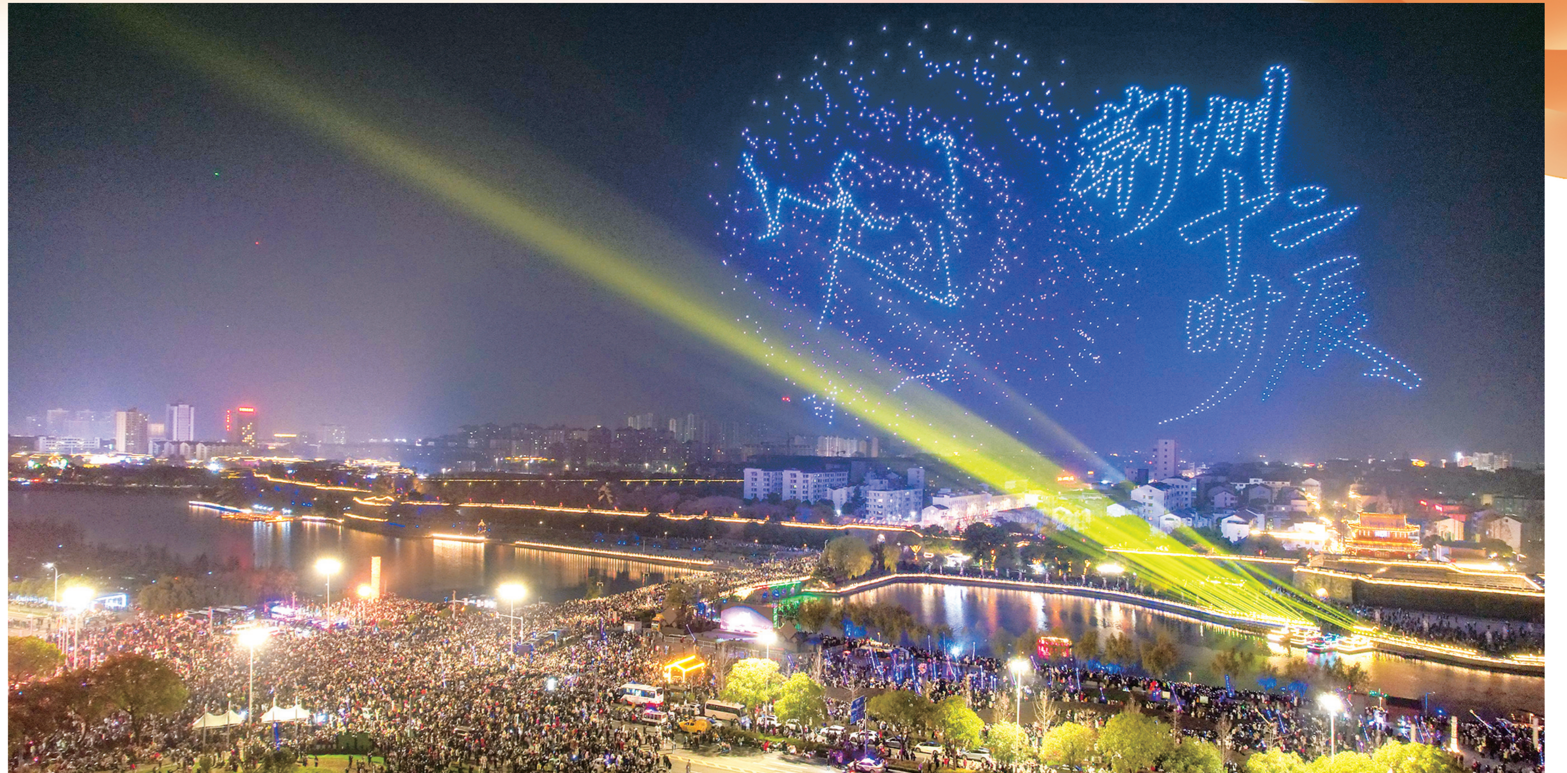
2026架无人机在荆州东门上空依次变幻造型,与全城共贺元旦。

文字:记者 宗禾 摄影:记者 叶力铭 梅闻 张梦瑶 潘路 肖琦 通讯员 邓柳楠 徐若楠 张恩 张佳欣 郑钟 尹士林