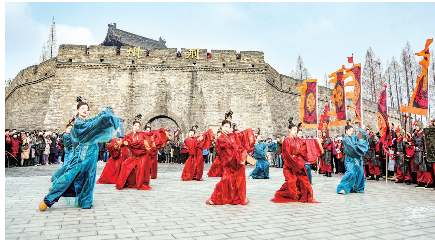
荆州古城东门景区举行“入城仪式”与“楚风巡游”活动,以隆重礼仪迎接八方宾朋。