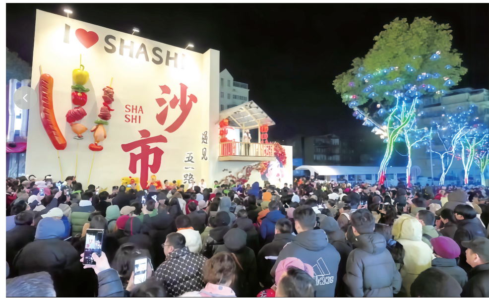
沙市五一商圈烟火气与文化味交织在一起,让市民游客幸福感满满。