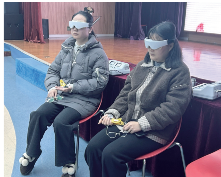
学生家长体验中医适宜技术。

本报讯(通讯员彭娟)近日,荆州市中医医院“杏林春苗”走进大寨巷小学,为该学校学生家长带来了一场主题为“小小‘睛’彩未来 中医科普护眼力”的专题讲座。