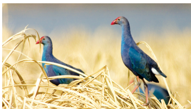
紫水鸡(国家二级保护动物)。