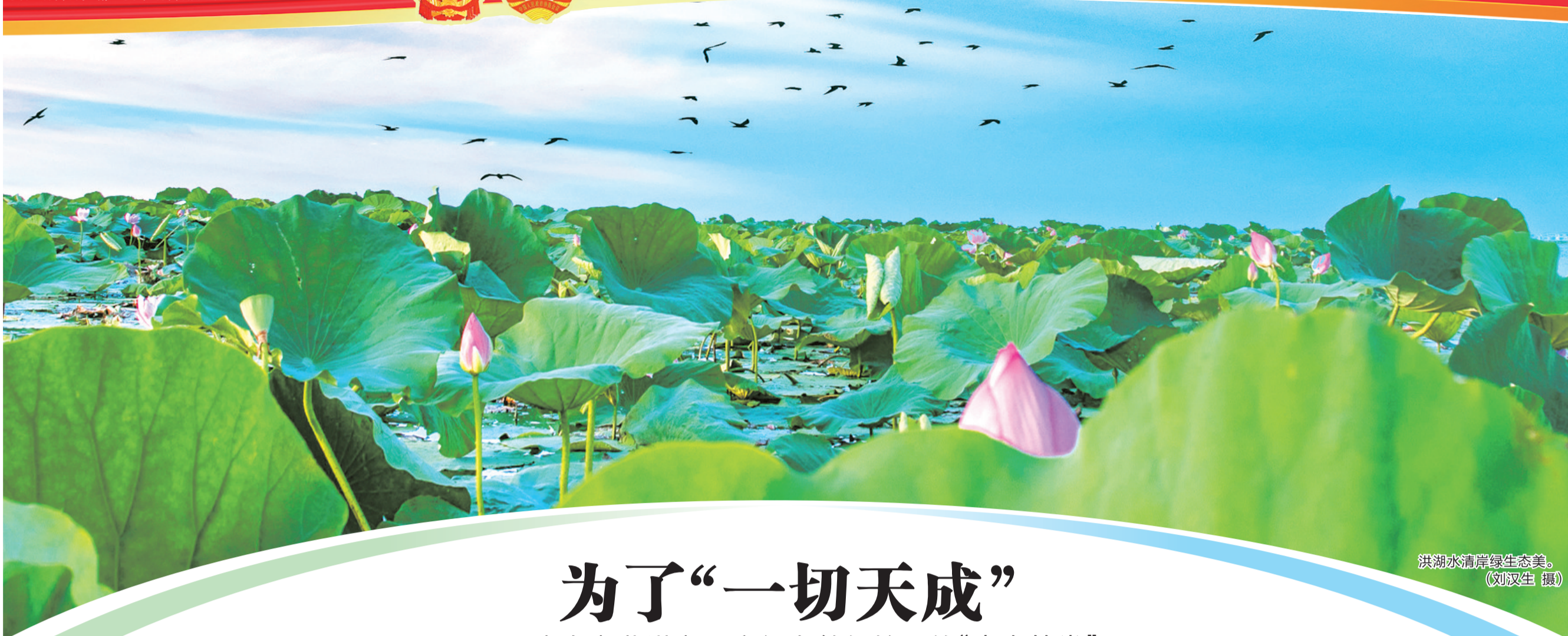
洪湖水清岸绿生态美。