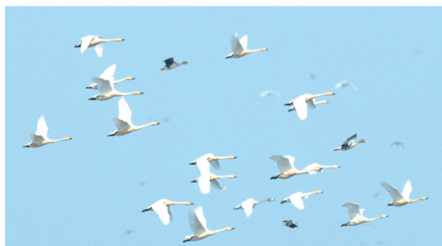
小天鹅(国家二级保护动物)。