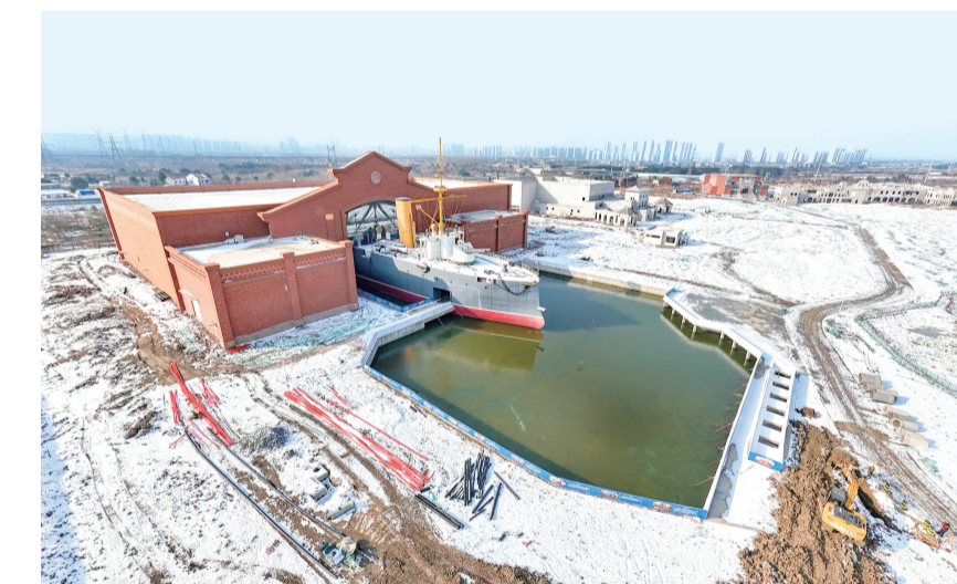
1月22日,航拍荆州方特二期探险乐园项目建设现场,该项目正加速推进。项目建成后,将进一步丰富荆州文旅业态,吸引更多市民和游客前来体验,助力荆州文旅产业强劲发展。