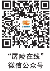
“孱陵在线” 微信公众号