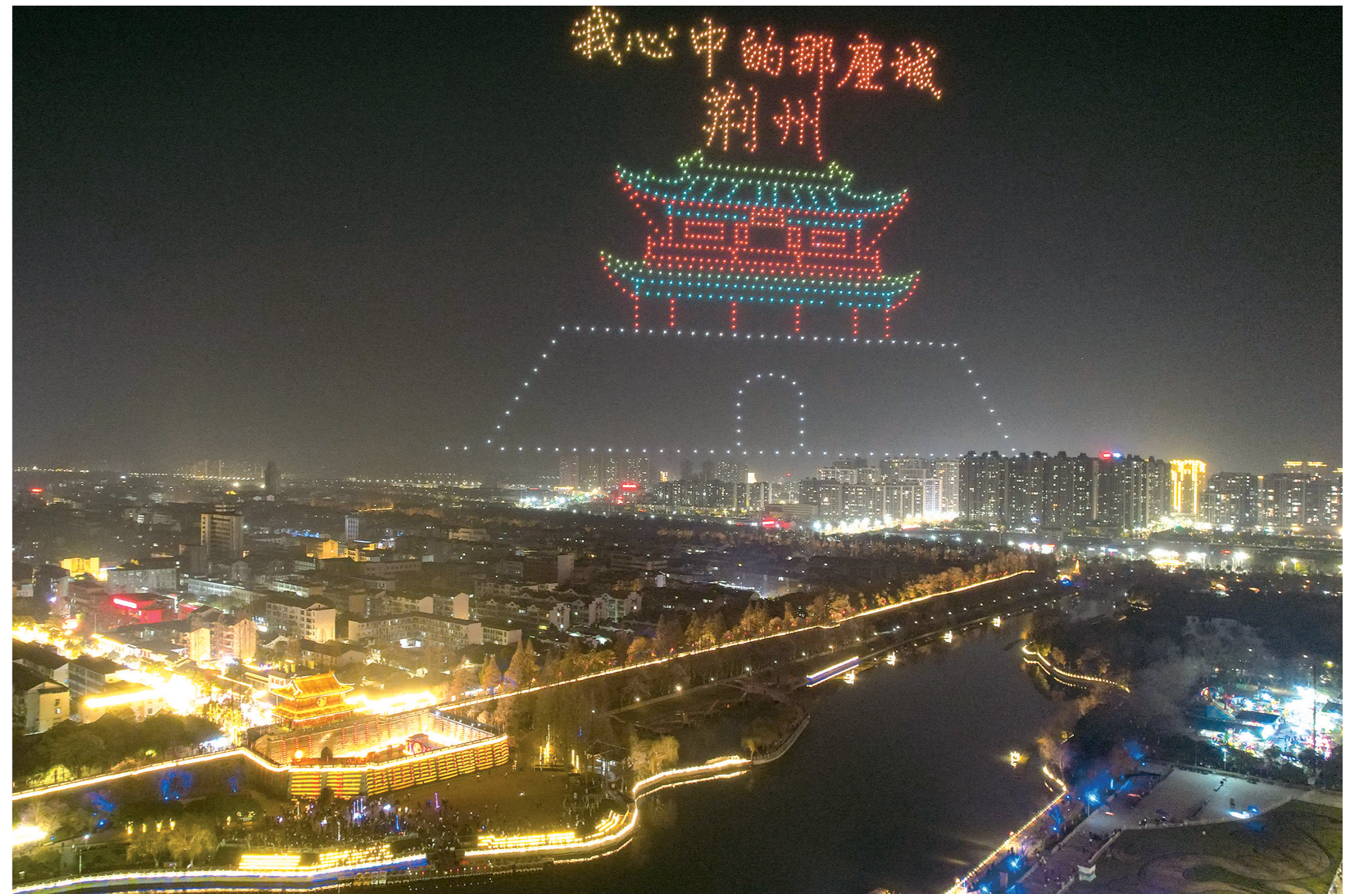
春节期间,“凤舞九天”无人机秀、荆风楚韵灯光秀在荆州古城东门上演,千架无人机点亮夜空,为八方来客带来一场美轮美奂的视觉盛宴。

2月17日,荆州千架无人机腾空贺新春的震撼画面,亮相央视新闻频道《新闻直播间》; 2月18日,央视财经频道聚焦荆州年味,播出《百年老街焕新颜 烟火年味暖人心》专题报道; 2月22日,新华社、中新视频不约而同将镜头对准“荆州十二时辰·楚乐八百年”的首演,让八百年楚韵在当代夜空下重新鸣响…… 从央视镜头到全网刷屏,2026年的荆州春节,就在这片锣鼓喧天与光影交织中,强势出圈。 全市围绕“马跃新春·畅游荆州”主题打造了300场特色文旅活动,这座历史文化名城以前所未有的开放姿态,将传统的年俗、厚重的文脉与酷炫的科技融合在一起,烹制出了一席色香味俱全的“楚味年宴”。 从街头巷尾的民俗巡游到穿越千年的文化演绎,从智能科技的新潮体验到璀璨夺目的光影秀场,荆州让市民游客在沉浸式体验中感受传统年俗的新表达。