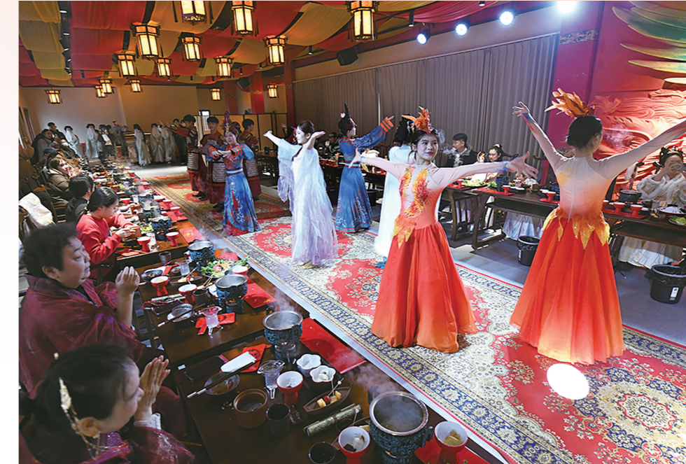
荆州古城三义街举行沉浸式餐秀《三国宴》,让广大市民游客在享受美食的同时,感受荆州深厚的历史文化底蕴。