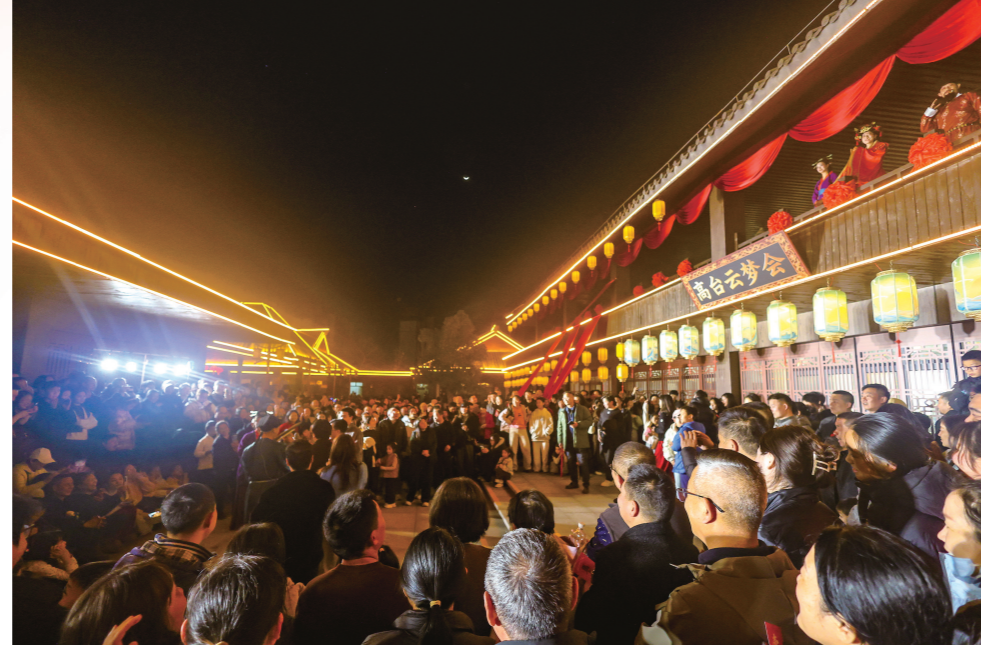
2月21日晚,“荆州十二时辰·楚乐八百年”春节档文旅活动中,市民游客踊跃参与实景互动剧《高台云梦》。