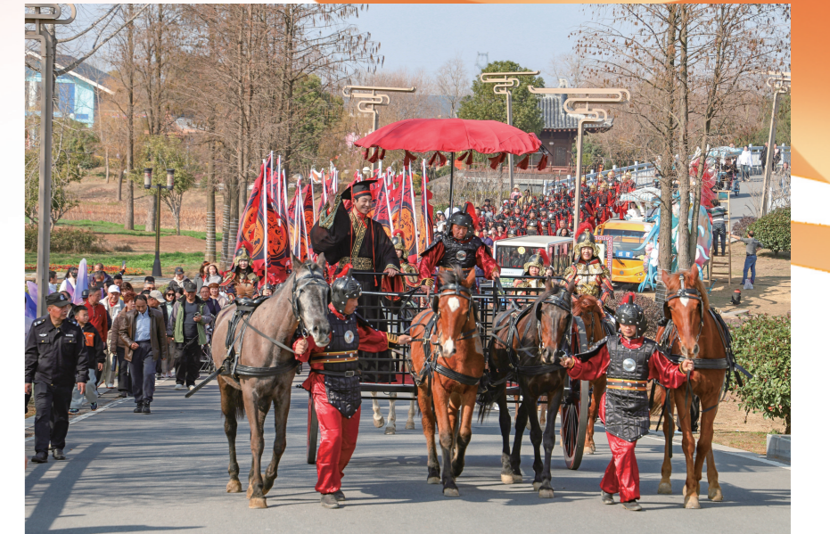
2月20日,“楚王巡游”大型实景演艺在荆州园博园首演,让市民游客沉浸式感受楚都鼎盛气象。