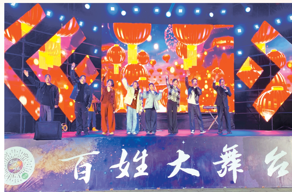
春节期间,荆州十二时辰“新春江湖音乐会”在老南门广场激情奏响,广大市民游客在欢快的氛围中感受荆州文旅的丰富多彩。