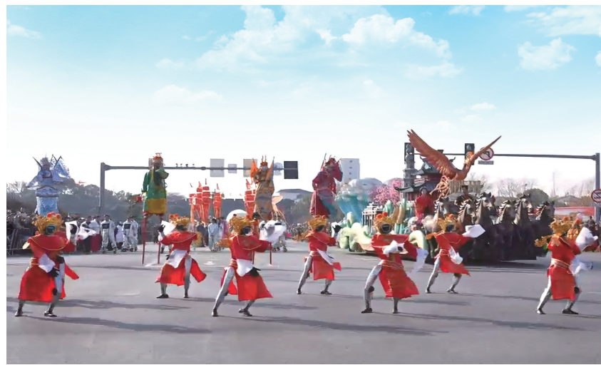
春节期间,古城东门外,身着红色服饰的智能机器人现场秀才艺,科技范十足。