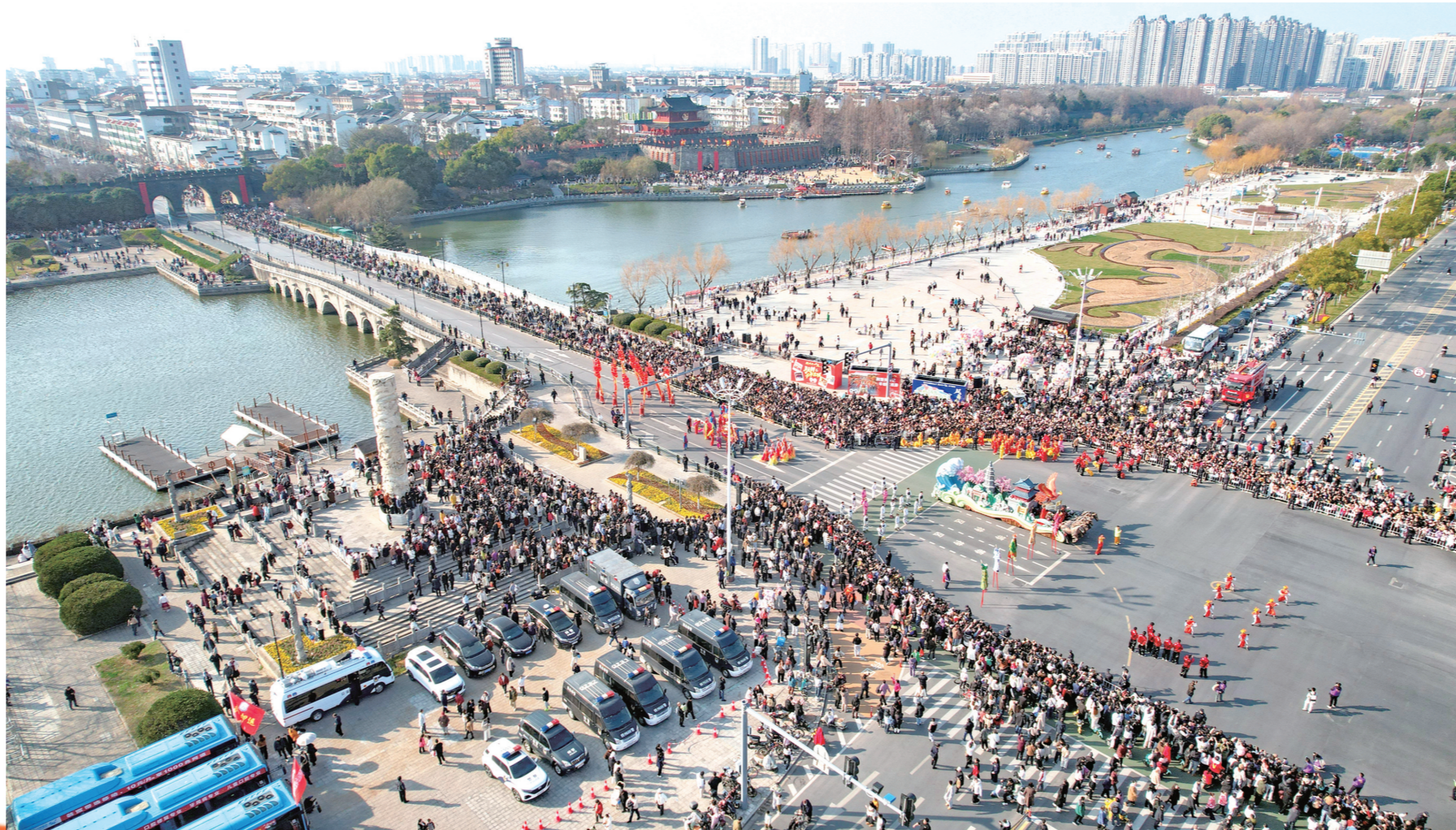
2月19日,荆州十二时辰“荆楚岁时记”年俗巡游在荆南路精彩上演,传统年俗与现代潮流联动,一场穿越古今的街头大戏将年味拉满,燃动新春。