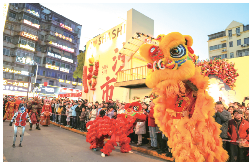
春节期间,沙市一路张灯结彩,人潮涌动,众多市民游客体验春节民俗巡游等活动。