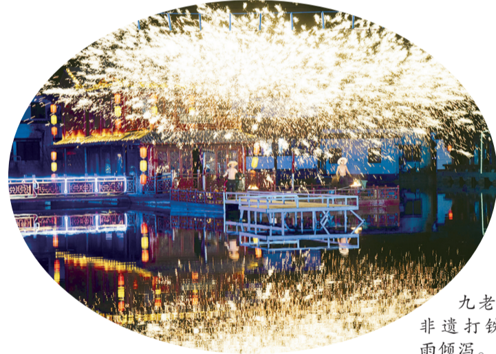
九老仙都内,非遗打铁花如星河倾泻。

为云雾缭绕的秘境,“千灯万福·元宵启祥”2026元宵祈福盛会如约而至,为市民游客献上一场融合传统民俗与沉浸式体验的文化盛宴。随后,非遗“打铁花”在景区内震撼上演,铁水腾空迸散,如星河倾泻,映红夜空;“烟花瀑布”流光溢彩,引得游客连连惊叹;游客齐聚水畔,将承载美好心愿的荷花灯盏放入水中……这场融合传统技艺与沉浸式祈福的视听盛宴,不仅点亮了元宵之夜,更点燃了游客对新年的希望与憧憬。