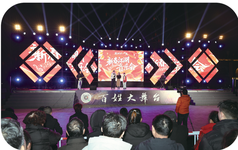
老南门百姓大舞台歌声嘹亮。

本报讯(记者倪悦 徐雪晴)3月3日,荆州十二时辰·南门歌王争霸赛元宵特别场在老南门火热开唱。活动以歌会友、以乐传情,线上线下同步狂欢,为市民游客献上一场视听盛宴。