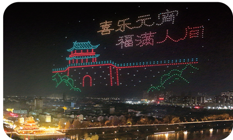
千架无人机点亮古城东门夜空。

正月十五月圆,古城荆州焕新颜。在这个万家团圆的夜晚,荆州匠心独运,用“荆州十二时辰”特别节目,将古城文脉与楚风新韵巧妙融合,几大片区各显神通,为市民游客奉上一场跨越时空的沉浸式元宵盛宴。