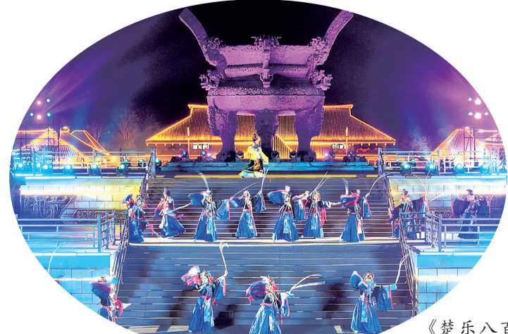
《楚乐八百年》表演再现楚韵风华。

园区内,猜灯谜、实景互动剧、非遗展演等活动同步开启,元宵民俗与楚文化体验相映成趣,游客沉浸其中,体验传统佳节之乐。活动尾声,楚韵旋律与现代音乐共奏,游客与演员共舞,在欢声笑语中定格元宵团圆美好时刻。