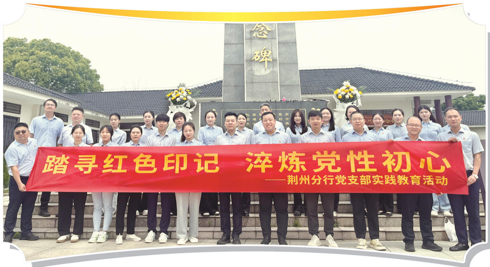
开展主题党日活动。

根植荆楚沃土,立足发展实际,长期以来,浦发银行荆州分行始终坚守金融为民初心,勇担国企金融使命,将党建引领贯穿经营发展全过程,紧扣金融“五篇大文章”建设要求,以消保服务筑牢金融安全防线,以本土深耕赋能地方经济建设,在市场竞争的浪潮中迎难而上、聚力突破,通过全员协同、精耕细作、创新实干,在业务攻坚、客户服务、本土赋能等领域交出亮眼答卷,让浦发金融的奋斗底色在荆州这片热土愈发鲜明,以高质量金融服务为地方经济社会发展注入强劲动能。