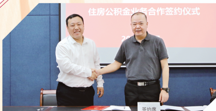
与荆州住房公积金中心签署合作协议。

坚守金融初心,践行国企担当。站在“十五五”新的发展起点,浦发银行荆州分行将继续以党建为引领,持续深耕金融“五篇大文章”,不断完善消保服务体系,深化本土市场深耕,以更坚定的信念、更务实的举措、更优质的服务,攻坚克难、勇毅攀高,在服务荆州经济社会高质量发展的道路上持续发力,让浦发金融成为荆州发展的坚实金融后盾。