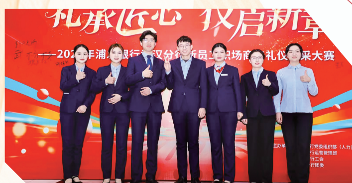
参与职场礼仪风采大赛。