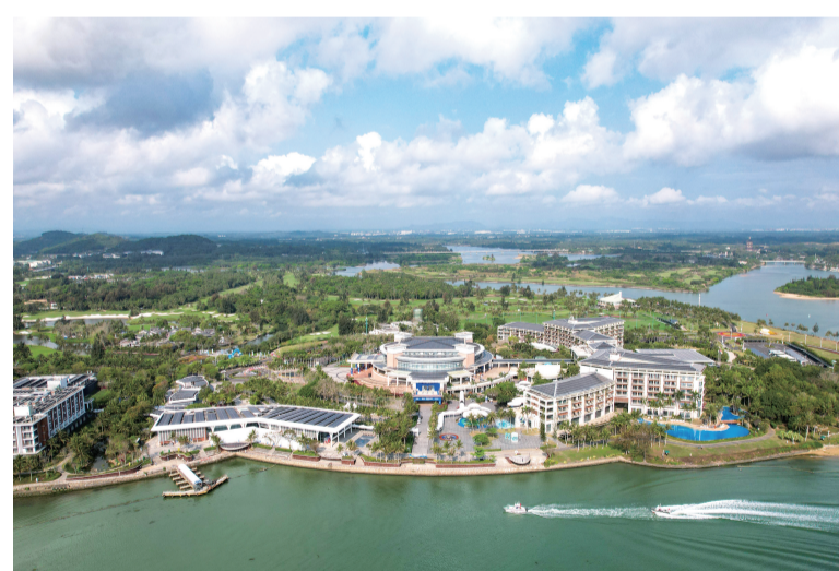
这是3月20日拍摄的博鳌亚洲论坛国际会议中心(无人机照片)。博鳌亚洲论坛2026年年会将于3月24日至3月27日在海南博鳌东屿岛举行,主题为“塑造共同未来:新形势、新机遇、新合作”。目前,各项工作已准备就绪,静候盛会启幕。