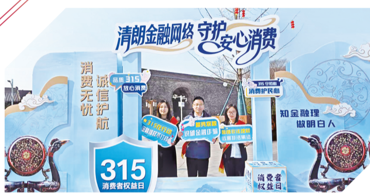
参与荆州市“3·15”金融消费者权益保护教育宣传活动。