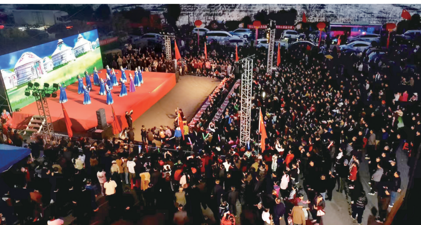
近日,石首市“红色印迹 薪火相传”活动在横沟镇百花社区红色文化广场举行,以此缅怀革命先烈、赓续红色血脉,激励全镇干部群众传承英烈精神,为乡村振兴与地方发展作出积极贡献。

4.1吨,同时依法收缴违规渔网5个,有效疏通了水道、恢复了渠域生态原貌,改善了干支渠通行条件和周边环境。 下一步,该街道河湖长制办公室将严格落实常态化管护机制,通过日常巡查、及时清理、环保宣传等方式巩固整治成果,打造水清、岸绿、渠畅的宜居环境。