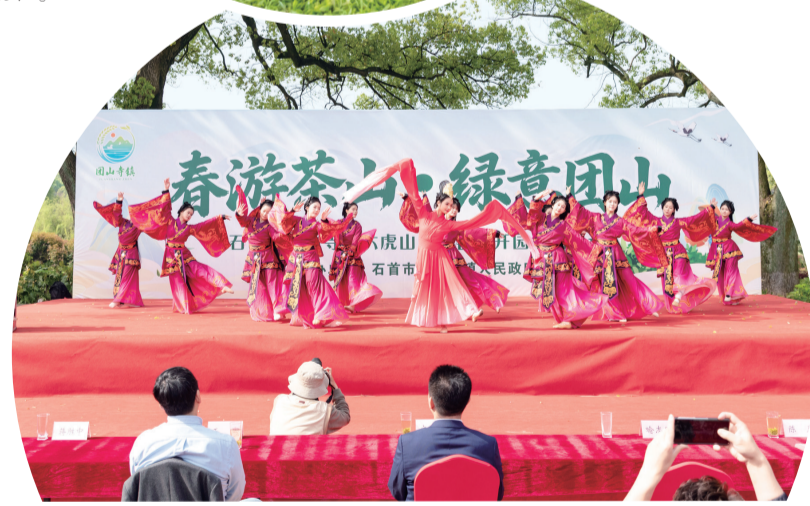
精彩的文艺展演拉开序幕。