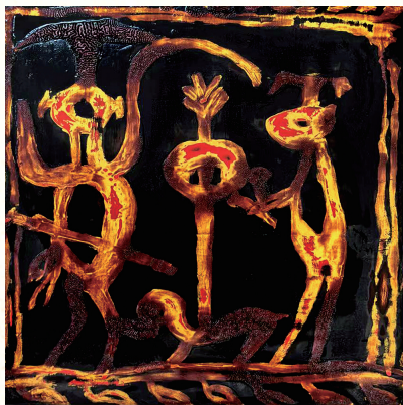
《楚乐》 作者 陈晶晶