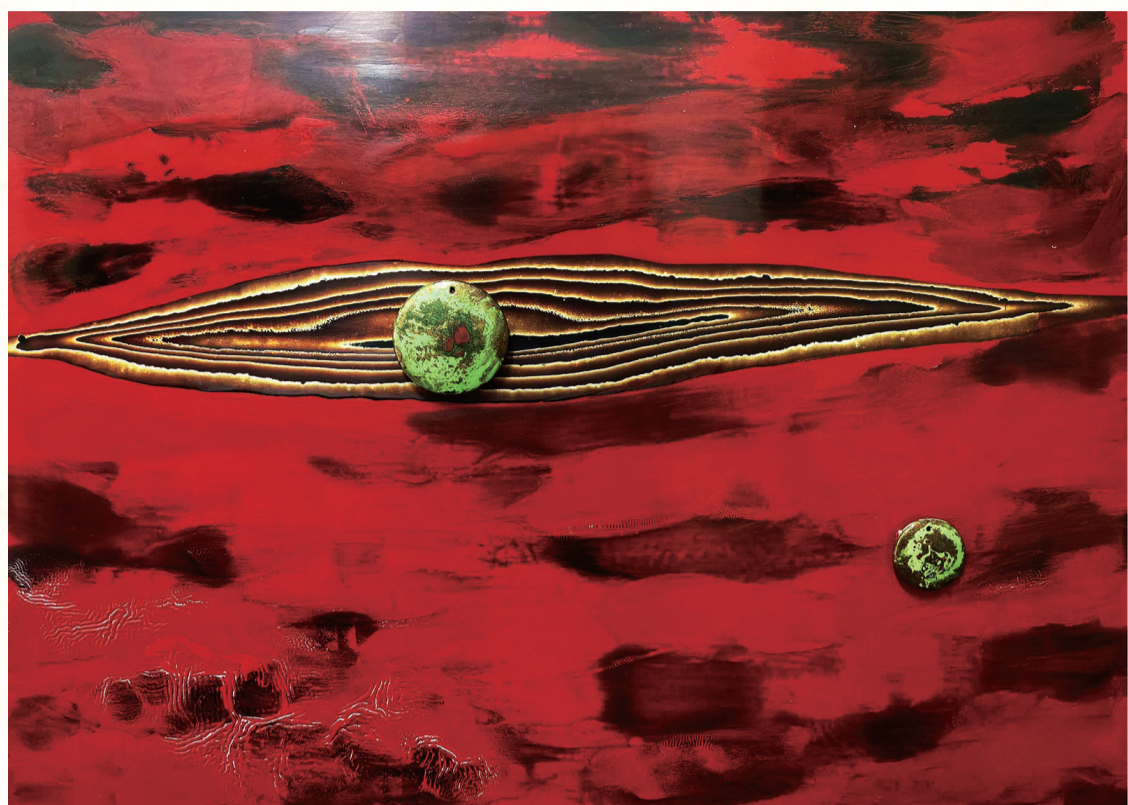
《苍穹之泪》 作者 郭健康