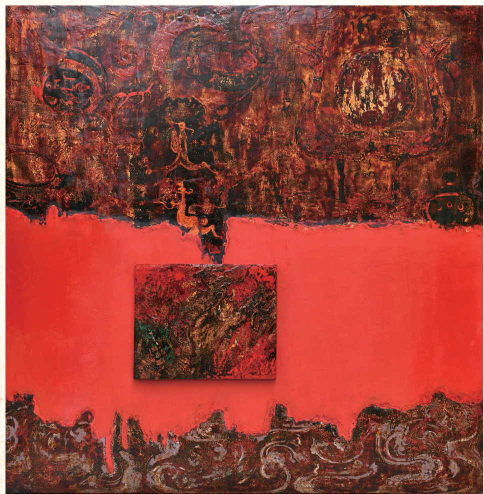
《寻楚记》 作者 郑启俊