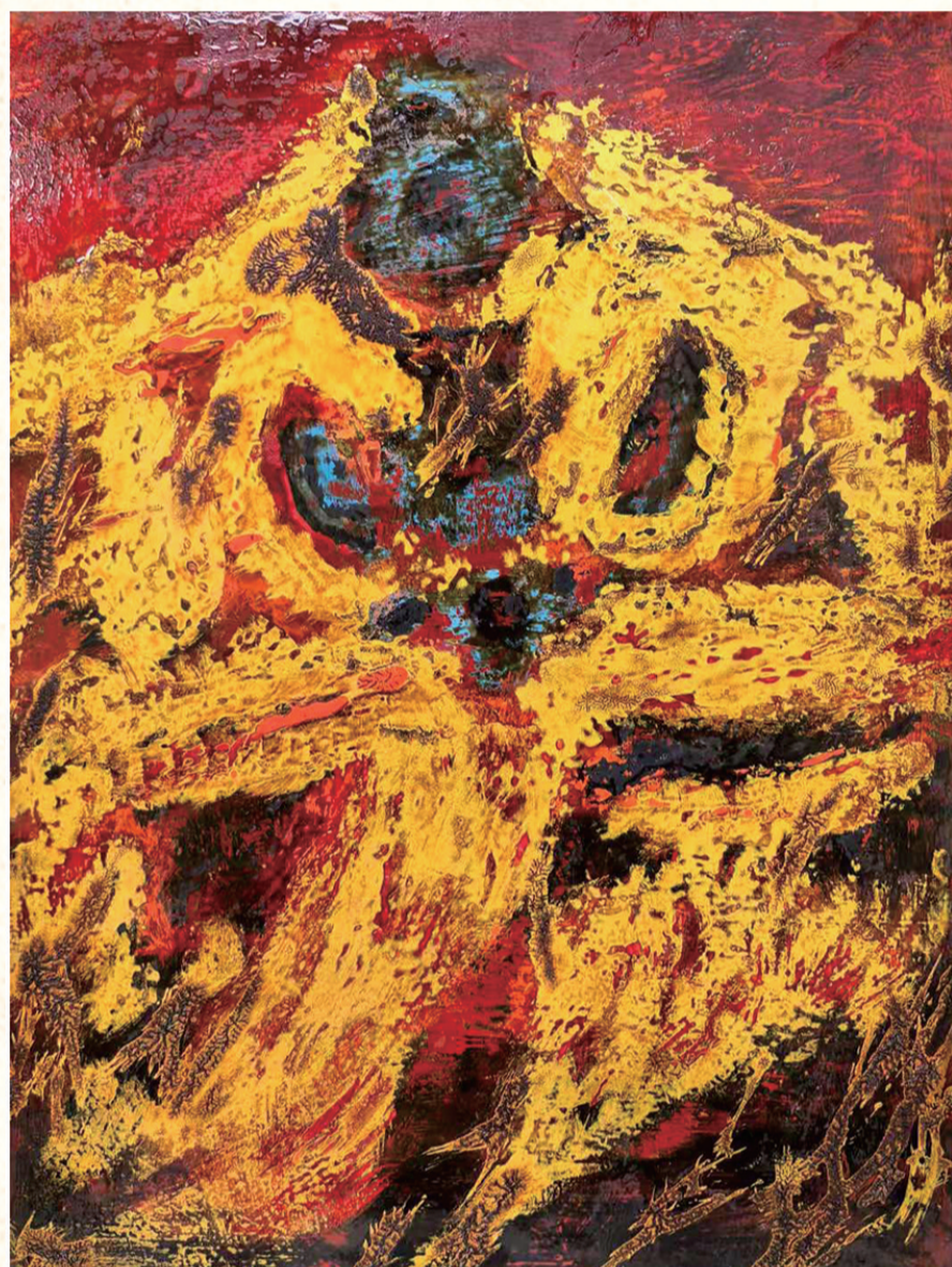
《丹漆流光映楚魂》 作者 胡莉